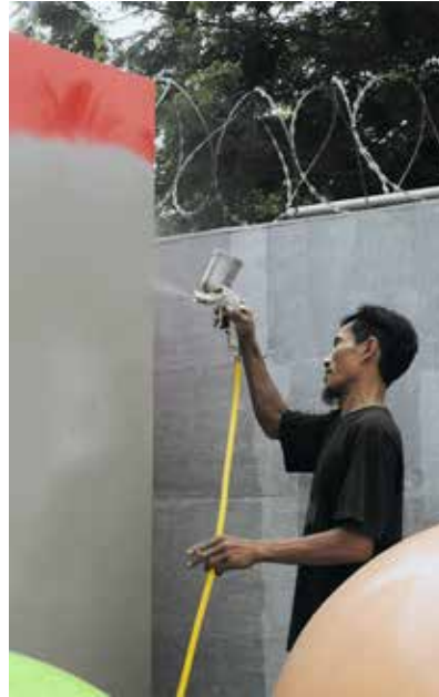
Ruiskumaalaus tehdään ilman suoja ja kunnollisia työvaatteita.

Lomia ei ole, kuten ei myöskään minimipalkkoja. Palkat maksetaan tai