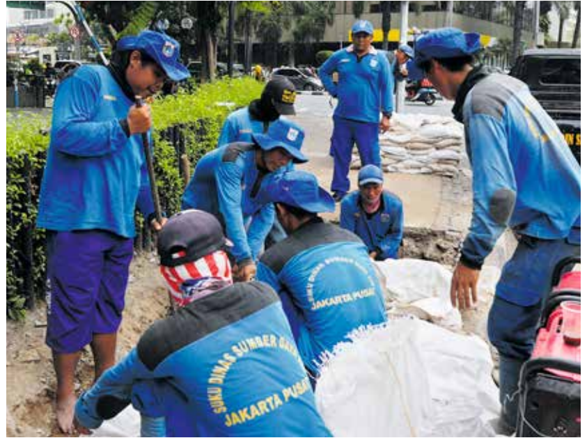
Paljaat varpaat käyvät työkengistä.

Kaikista haasteista huolimatta eri liittojen edustajat uskovat siihen mitä tekevät ja toivoa on. Mietin kuinka