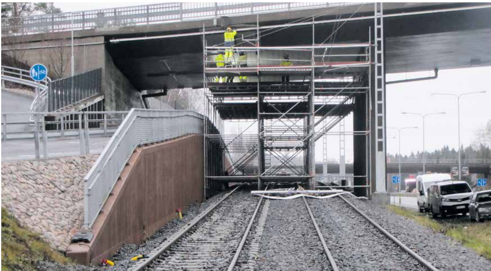
Loppusyksyn harmaana päivänä viimeisteltiin Tampereella ratikan ylittävän ratasillan alapintaa. Sillalla kulkevaa rataa tehtäessä, 1800-luvun lopussa, menehtyi työmaalla peräti 14 työmiestä.