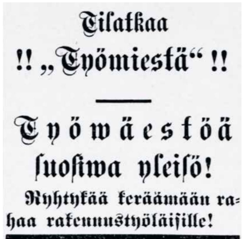
”Tilatkaa Työmiestä!! Työväestöä suosiva yleisö! Ryhtykää keräämään rahaa rakennustyöläisille!” (Työmies 25.4.1896)

Neuvottelut eivät johtaneet tulokseen ja komitea kutsui jäsenet koolle rakennustyöläisten yleiseen koko-