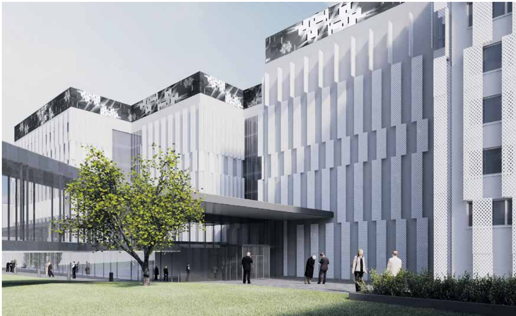
KYS Uusi Sydän 2025 -allianssi

KYS Uusi Sydän 2025 -työmaa palkittiin Rakennuslehden Vuoden Työmaa 2019 -kilpailussa ykköspalkinnolla. Työmaata arvioitaessa raatia miellytti hankkeessa käyttäjien ja tilaajien tyytyväisyys yhteistoiminnan ja tiedottamisen sujumiseen, työmaan hyvä yhteishenki, työntekijöiden ja aliurakoitsijoiden arvostus ja kuuntelu, halu oppia, erinomainen siisteys ja pölynhallinta sekä hyvä työturvallisuus. Raadin mukaan työmaalla kosteudenhallinta on hoidettu erinomaisesti.