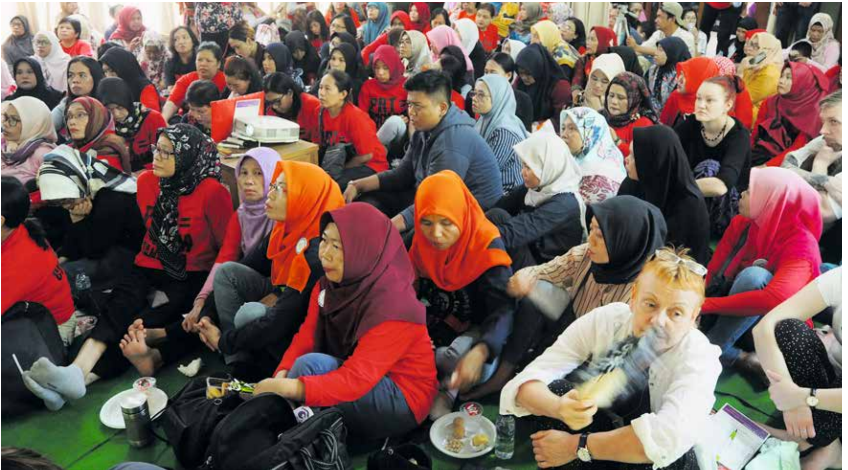
Tutustumisen aloitettiin kotiapulaisten liitosta.