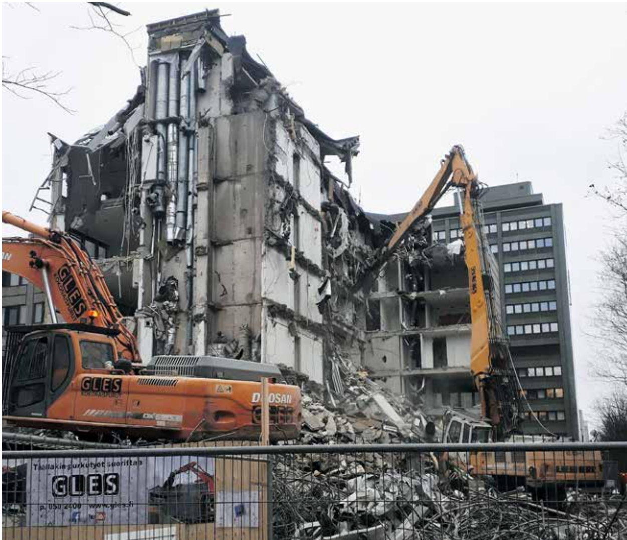
KUUKAUDEN KUVA Paikka: Pasila, Helsinki Aika: Marraskuu 2019

Mitä? Purkutyö on komeaa katsottavaa. Tässä rouskitaan palasiksi tyhjillään olevaa toimistotaloa asuinrakennusten tieltä Kellosillan kulmilla.