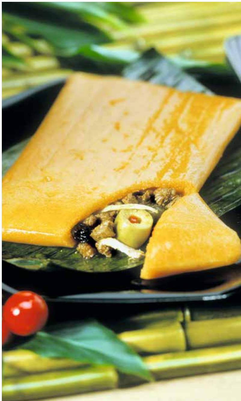
Hallacas on venezuelalainen jouluruoka. Siinä maissinlehdet täytetään paprikalla, lihalla, kapriksilla ja rusinoilla.

E simerkiksi Japanissa joulu-ruokailu ei ole perinteisesti ollut mikään ”kova juttu”. Vasta viime vuosikymmeninä sen suosio on kasvanut – tunnetun pikaruokaketjun joulukampanjoinnin ansiosta. Kyllä, luit oikein: harmonisen estetiikan ja kattauksen mallimaassa tykätään juhlistaa joulua Kentucky Fried Chicken -ravintoloissa! KFC:n joulukattaukseen havittelevat miljoonat, joten ateriat varataan kuukausia etukäteen.