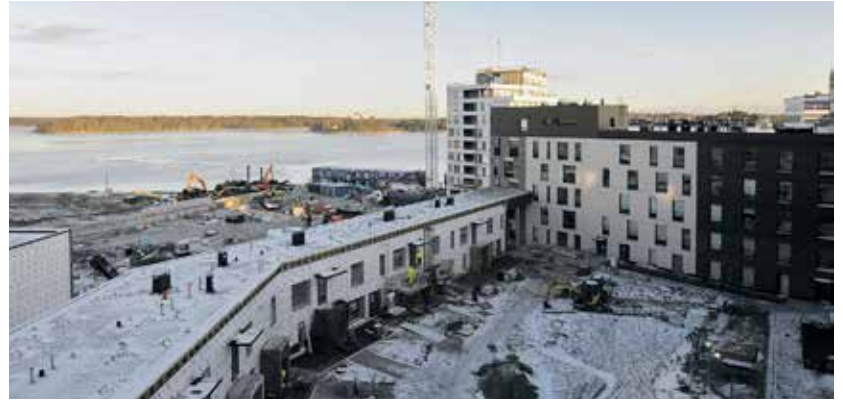
Wandan työmaalla viimeistellään nyt lamellitaloa ja vasemmalla näkyviä kaupunkipientaloja. Pientalojen katoille tulee viherkatot.