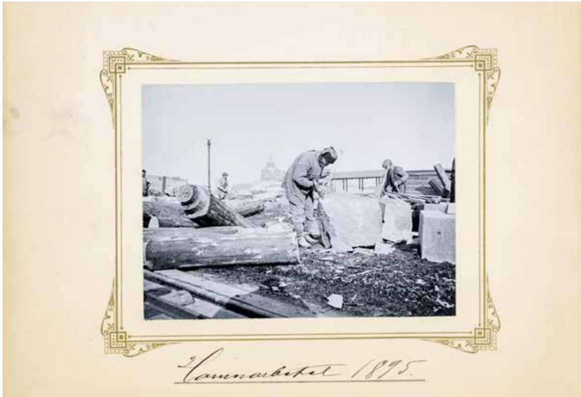
Laiturin rakennustöitä Makasiinirannassa Eteläsatamassa vuonna 1895..