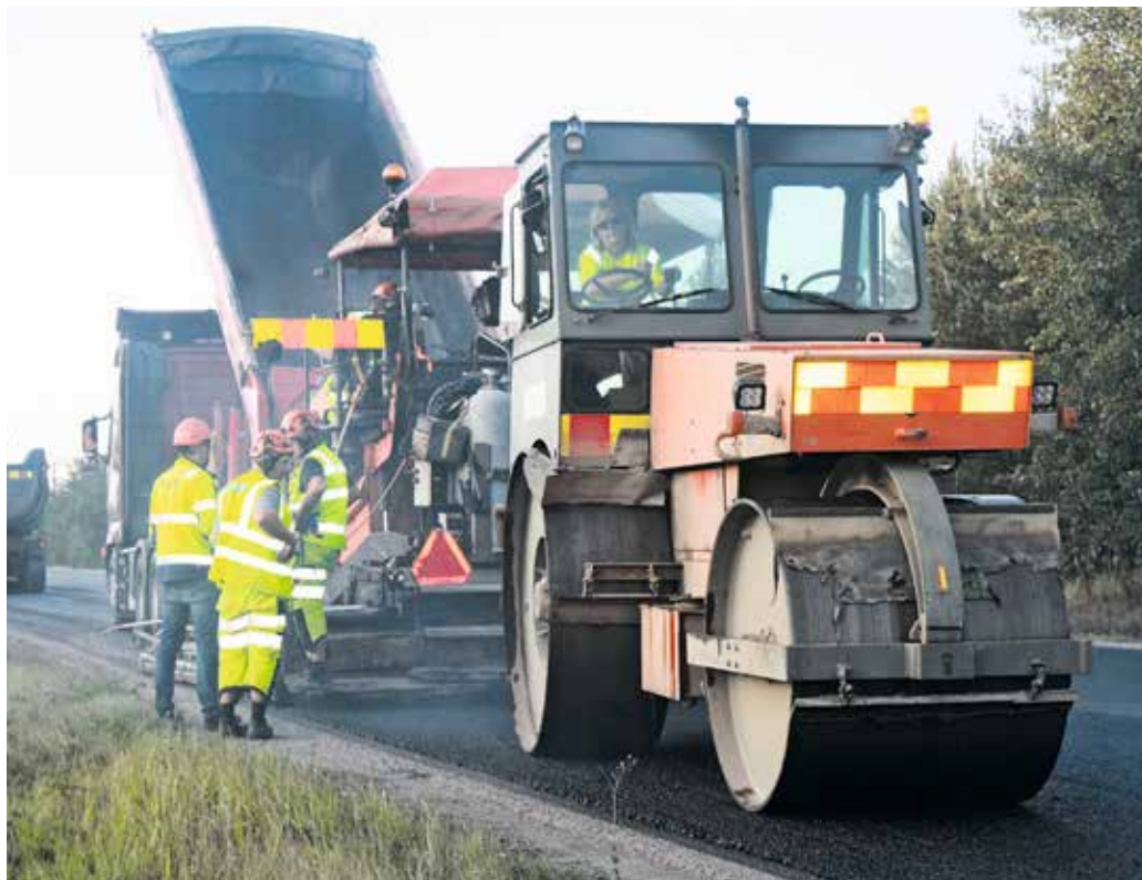
Asfaltti jyrätään lopuksi täysin tasaiseksi matkustuselämykseksi. Jyrän puikoissa Sirpa Flyktman.