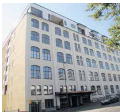
Tampereen keskustassa on entinen sosiaalitalo muutettu asuinkäyttöön ja samalla sitä on korotettu puisella lisäkerroksella. Vaikka puukerrostaloja rakennetaan Pirkanmaalla vielä vähän, tehdään lisäkerrokset yleensä puusta.

- Tämä on ongelma Suomessa. Keski-Euroopassa saumaton yhteistyö on opittu, mutta Suomessa se ei vielä ole kunnossa.