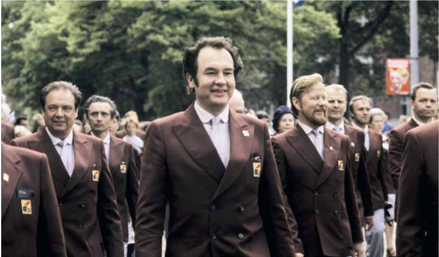
TUL:n näyttävä juhlamarssi Helsingissä 1979.