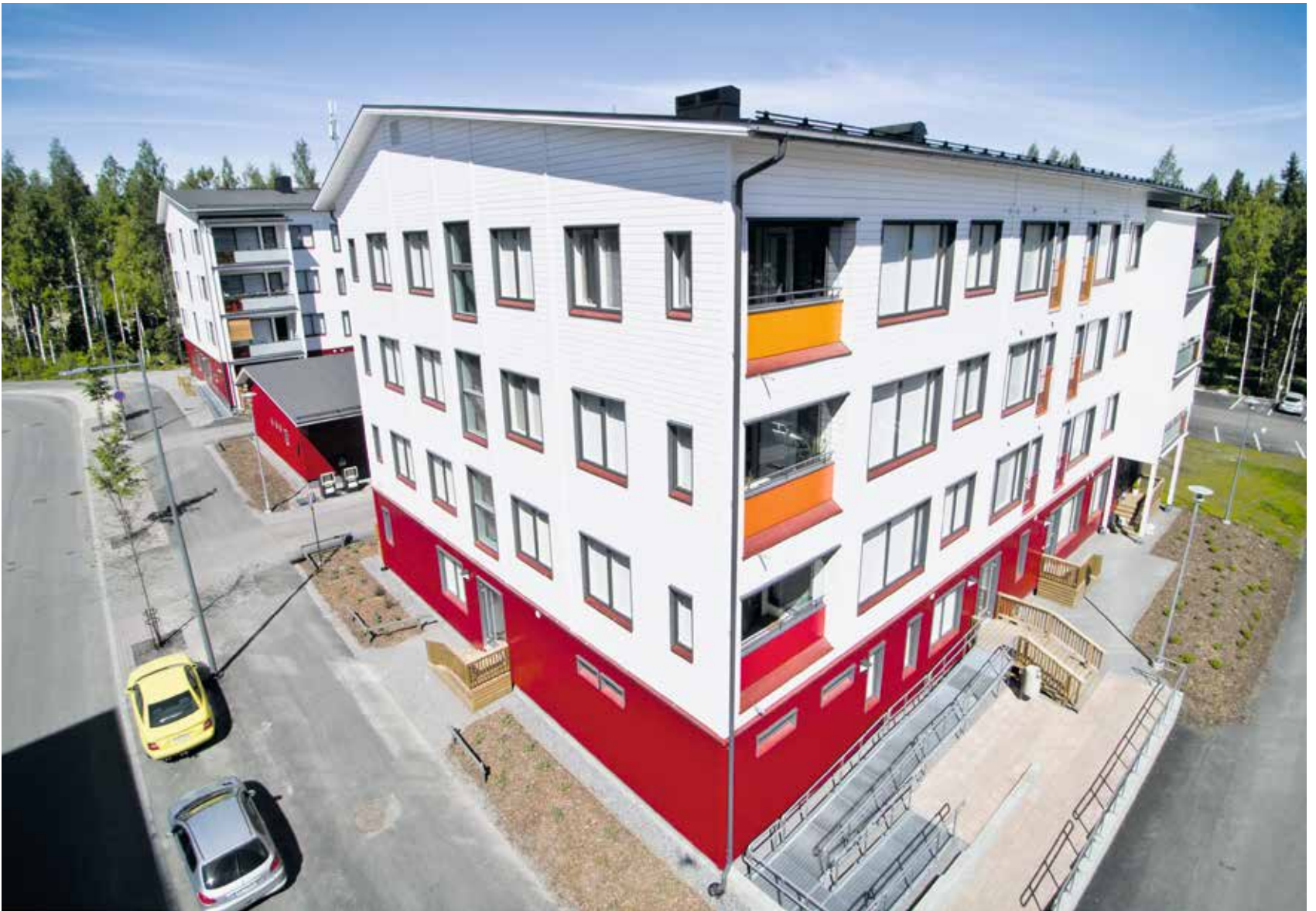
Tampereen Vuoreksen uudelle alueelle ovat jo valmistuneet ensimmäiset puukerrostalot. Lähivuosina alueelle on luvassa kokonaisia puukerrostalokortteleita.