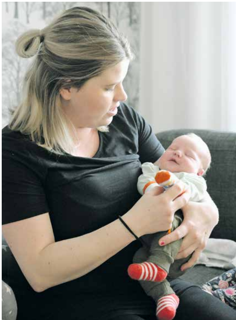
Nyt odotellaan napakkaa röyhtäisyä.

Naistenklinikalla oli tänä kesänä ruuhkaa, mutta perheellä oli tuuria ajankohdan suhteen.