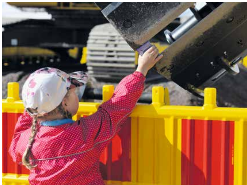
Pienille messuvieraille ojennettiin korttipakkoja isolla kouralla.

– Ei sitä itsekkään ole aina hyvällä päällä. Siihen on auttanut se, että menee jonnekin takametsään kaivamaan itseksensä. Parin viikon päästä sitä alkaa jo kysellä, missä ne työtoverit ovat?