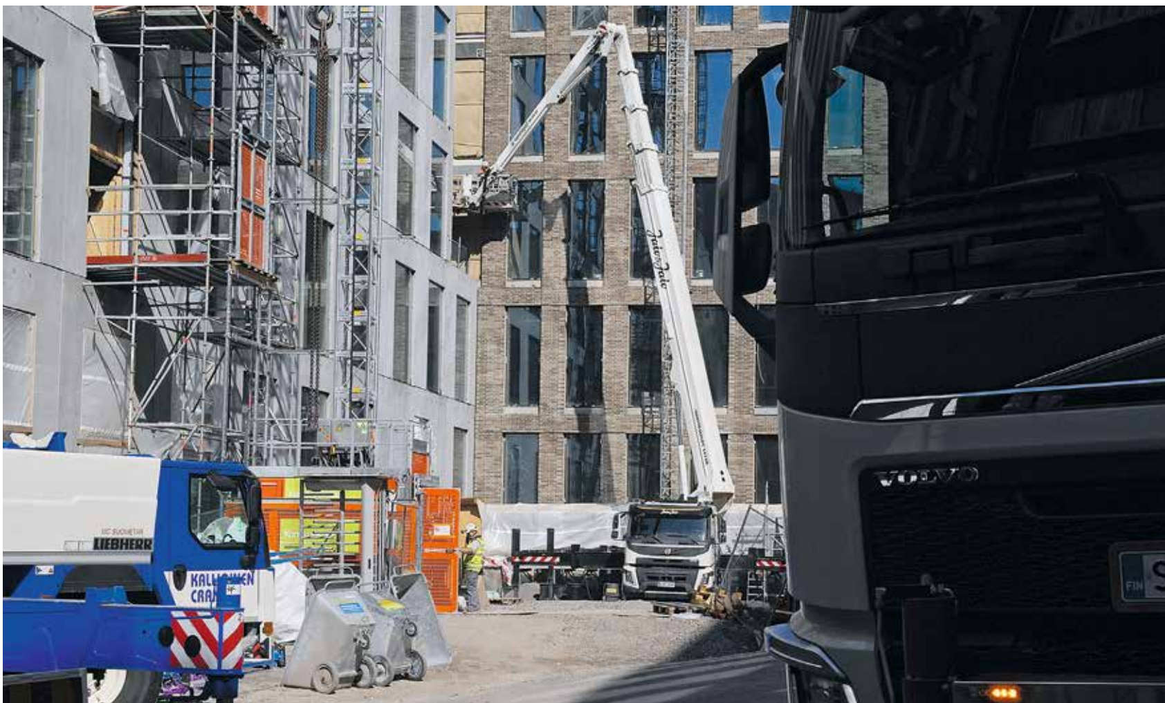
Dieselpakokaasut altistavat työntekijöitä ahtaissa ulkotiloissa syöpävaarallisille päästöille sen lisäksi, että ne ovat ongelma ilmastolle.