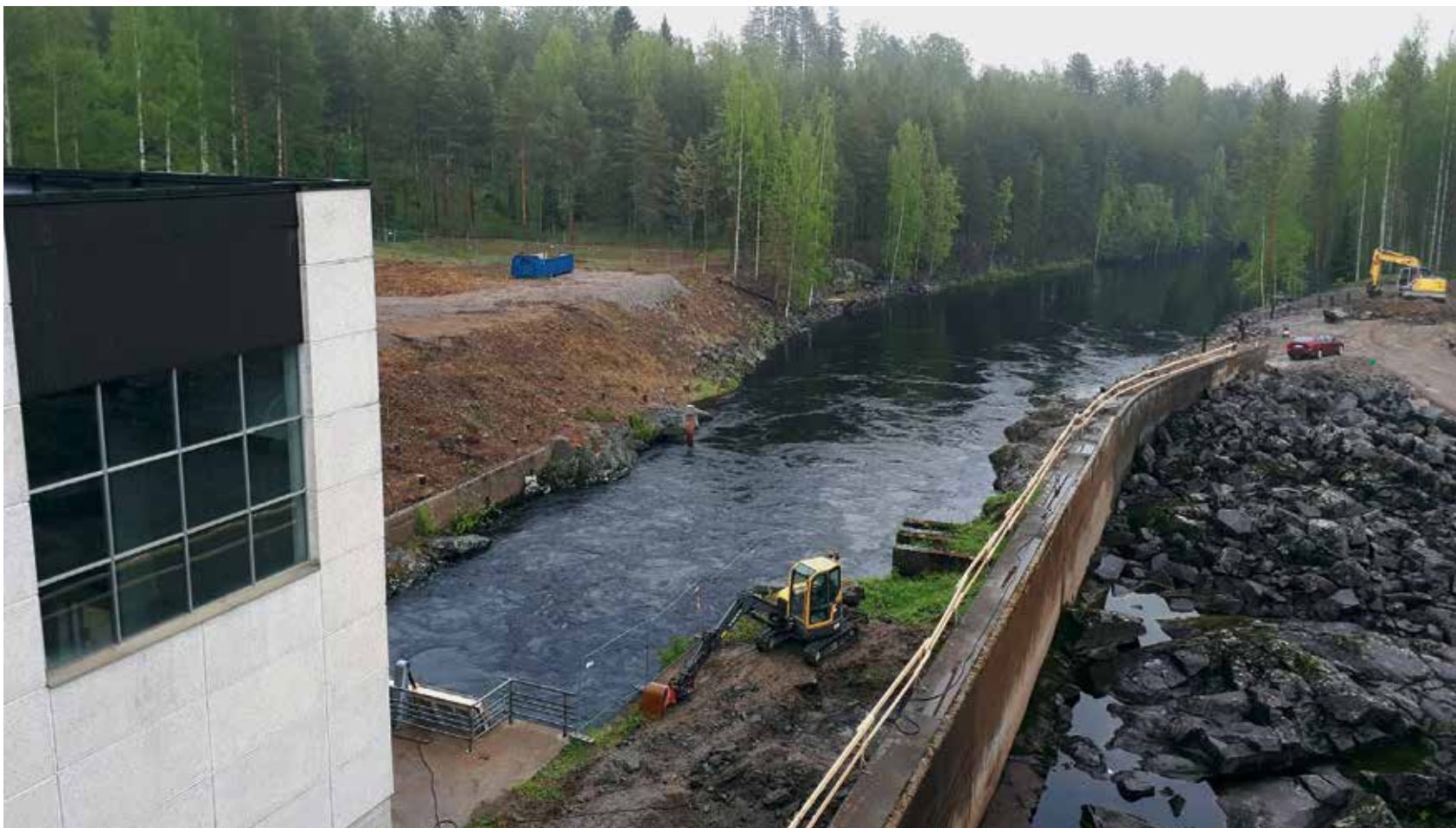
Kalatien työmaalla aloitettiin holvin tekeminen heinäkuussa. Kun kalatie otetaan käyttöön ensi vuonna, Vattenfall seuraa kalojen viihtymistä ja voi parantaa olosuhteita muun muassa veden määrää ja virtausnopeutta muuttamalla. Betonipohjalle on mahdollista tuoda kiviä muistuttamaan luonnosta.