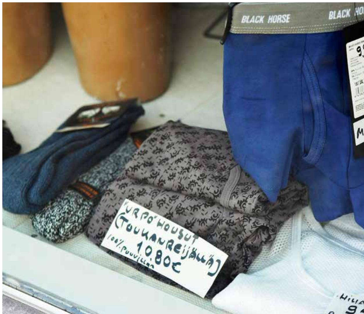
KUUKAUDEN KUVA Paikka: Helsinki Aika: elokuu 2019

Mitä? Markkinoinnissa on tärkeintä erottautua kilpailijoista.