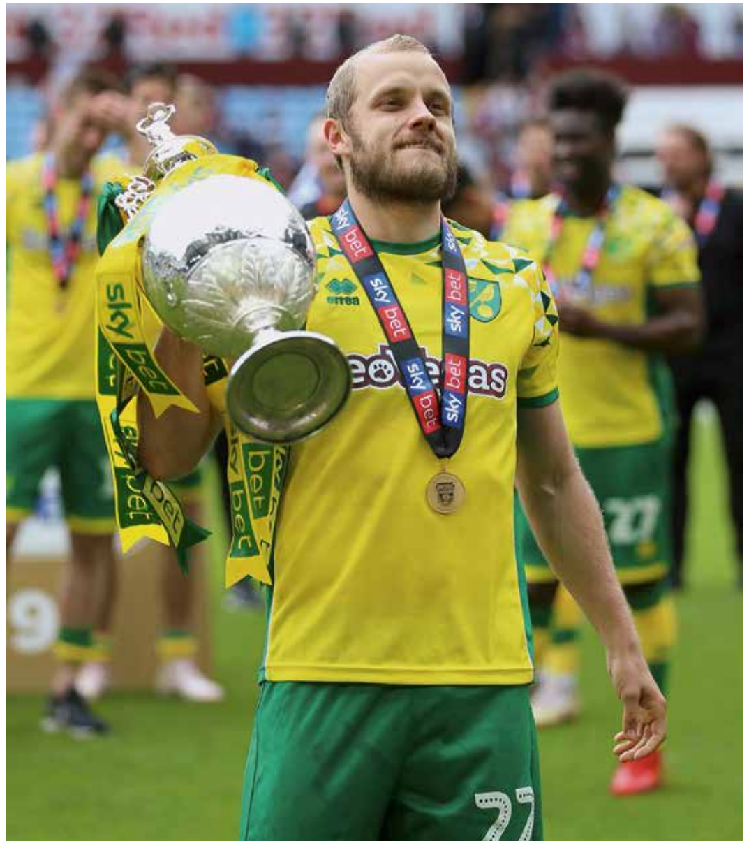
Teemu Pukki pääsi viime kaudella juhlimaan Championshipin voittoa ja putsamaan henkilökohtaisten palkintojen pöydän.

Pukin ura ei ole ollut pelkkää satua, vaan tarina nousuista ja laskuista sekä itsensä löytämisestä. Pukki lähti Kotkasta ujon teinilupauksena FC Sevillaan, mutta pääsi pelaamaan edustusjoukkueessa Espanjan liigaa vain vajaat puoli tuntia. Edessä oli paluu Suomeen ja HJK:n riveihin. Niin kutsuttu maitojunareissu, jota kukaan ulkomaille lähtenyt suomalaispelaaja ei halua tehdä, osoittautui Pukille menestyksekkääksi, ja hän sai unelmasiirron saksalaiseen FC Schalkeeseen. Siellä Pukki onnistui muuttaman kerran maalinteossa ja saavutti myös jonkin-