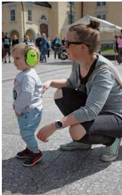
Yleisöä nuorimmasta päästä.

aikaan aloin itse soittaa kitaraa määrätietoisemmin.