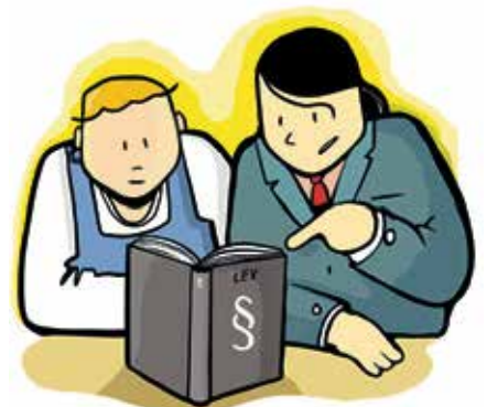
Rakennusliiton lakiosasto auttaa jäsentä.

– Ainoa tapa saada muutoksia häirintään suhtautumisessa on se, että näitä juttuja rapsahtaa asiaan puuttumattomien työnantajan kynsille tarpeeksi usein, Sinda toteaa. ■