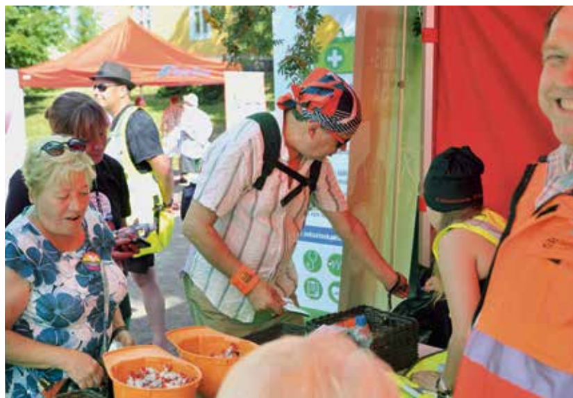
Tapahtumatorilla Rakennusliiton teltalla riitti vilskettä helteestä huolimatta. Oransseista Kova juttu -hikirannekkeista tuli iso hitti Työvään musiikkitapahtumassa.