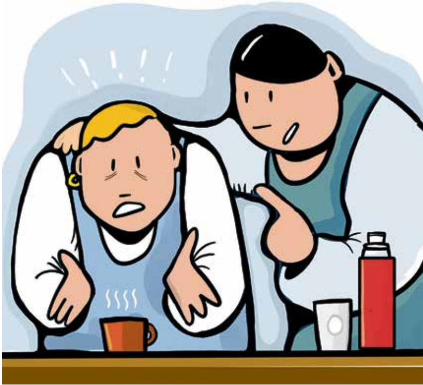
Älä jää yksin, älä vähättele kokemustasi. Työpaikan luottamushenkilöt ovat neutraaleja toimijoita, joiden kanssa voit puhua.

Objektiivisuus voi tarkoittaa myös lopputulosta, joka ei ole häirinnän kohteelle mieluinen. Työnantaja on velvollinen ryhtymään toimiin häirinnän poistamiseksi, mutta työnantaja harkitsee, mitä toimet ovat. Jos kyse on esimerkiksi yhdestä teosta, se selvitetään, tekijä saa mahdollisesti varoituksen ja kohteelta pyydetään anteeksi, eikä tilanne pääty tekijän potkuihin.