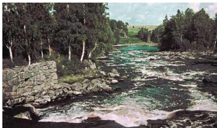
Hietamankosken kesäistä idylliä ennen voimalaitoksen ja padon rakentamista. Kosken keskellä olevalle saarelle soudettiin sunnuntairetkillä.

vat tyvenissä altaissa kivien välissä ja veden lämmitessä kalat hakeutuivat kosken kuohuihin, koska siinä on paljon happea. Taimenet nousivat Päijänteeltä esi-isiensä tavoin. Koska