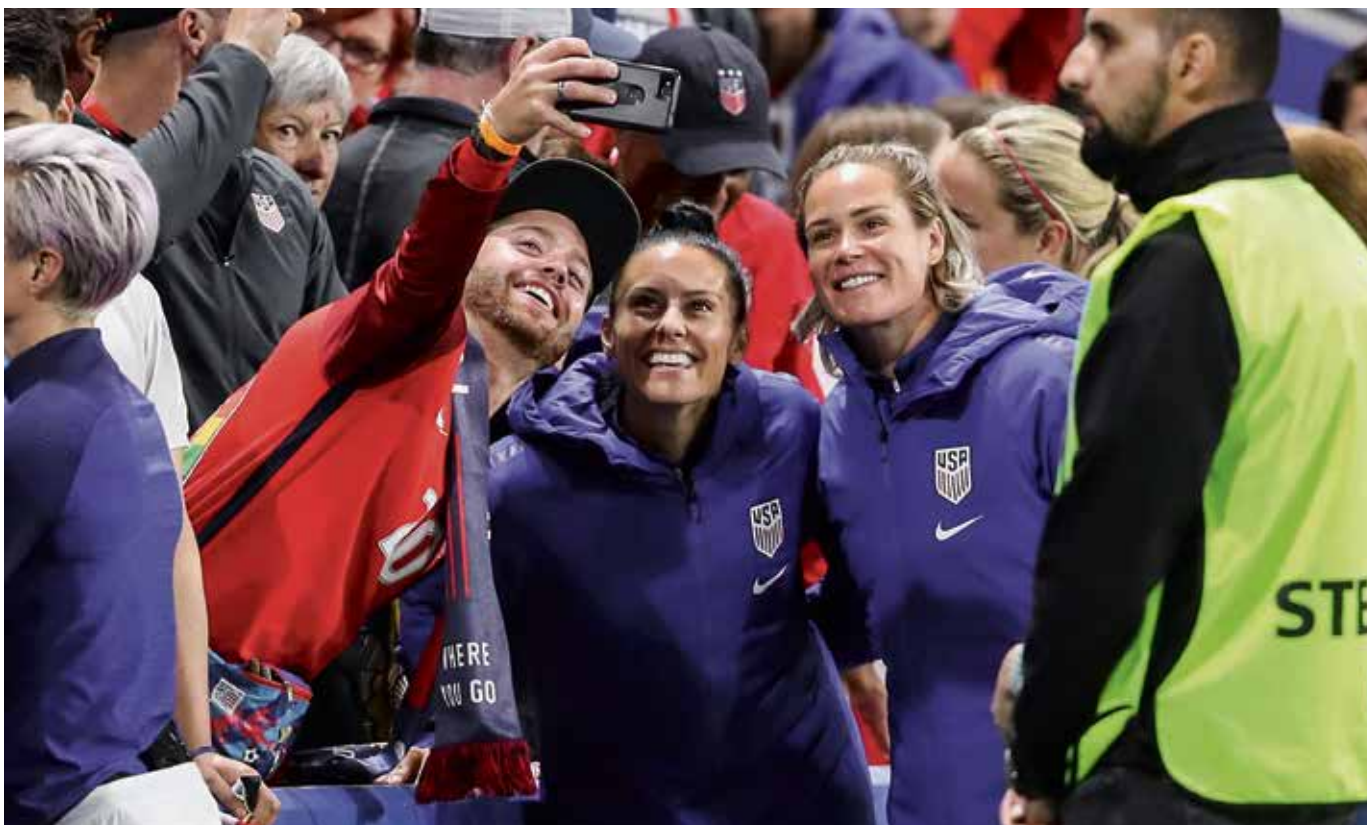
Yhdysvaltain naisten jalkapallomaajoukkueen Ali Krieger ja Ashlyn Harris ovat paitsi joukkuekavereita, myös kihlapari.