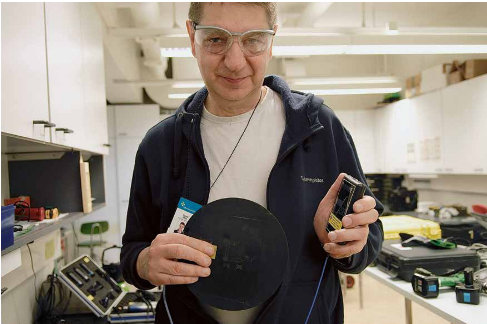
Kehon kokema värinän määrä selviää ajoneuvon istuimelle asetettavan matalan anturiytynyn avulla.