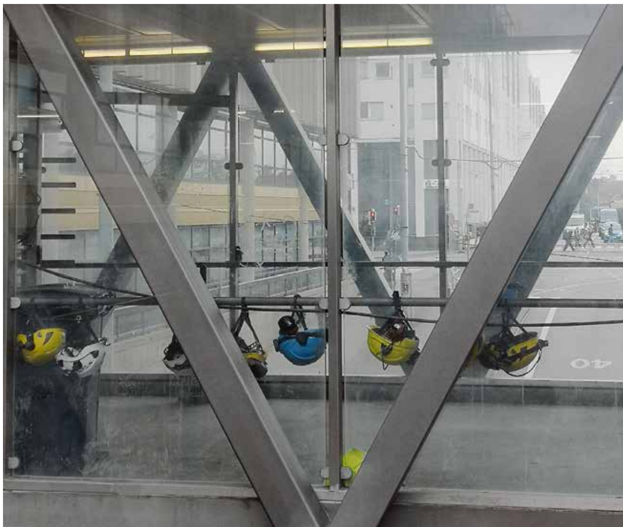
KUUKAUDEN KUVA Paikka: Helsinki Aika: Heinäkuu 2019

Mitä: Kypärien päivähoitopaikka Pasilan Triplassa. Pasilan jättimäisen työmaan, Triplan rakentajat säilövät kypäränsä Opastinsillan viereen söpöihin riveihin mennessään lounaalle. Miten omansa erottaa joukosta?