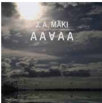
J. A. Mäki: Aavaa . If Society

PITKÄN uran tehnyt muusikko ja kulttuurin sekatyöläinen Jyrki Anselmi Mäki on julkaissut ensimmäisen soo-