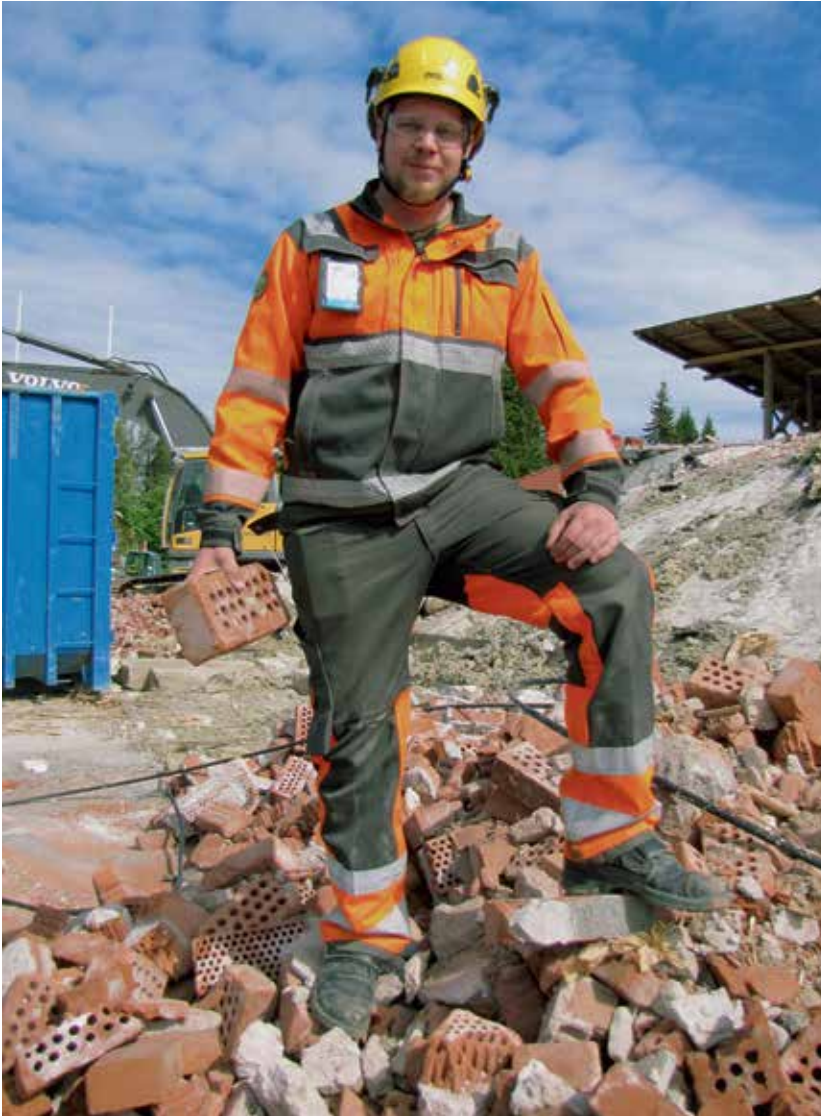
Purettavan rakennuksen tiilet kerätään omaan kasaansa.

on talojen rakenteisiin voitu kätkeä yhtä ja toista mielenkiintoista. Hänen kaivurin kauhansa ei kuitenkaan ole osunut mihinkään sellaiseen.