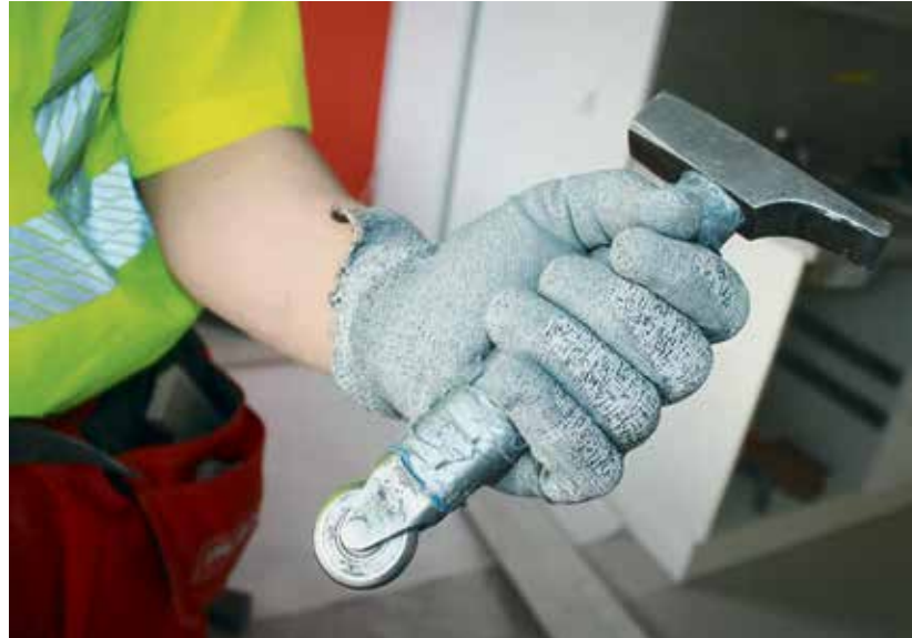
Mattomiehien vasara, aina mukana.