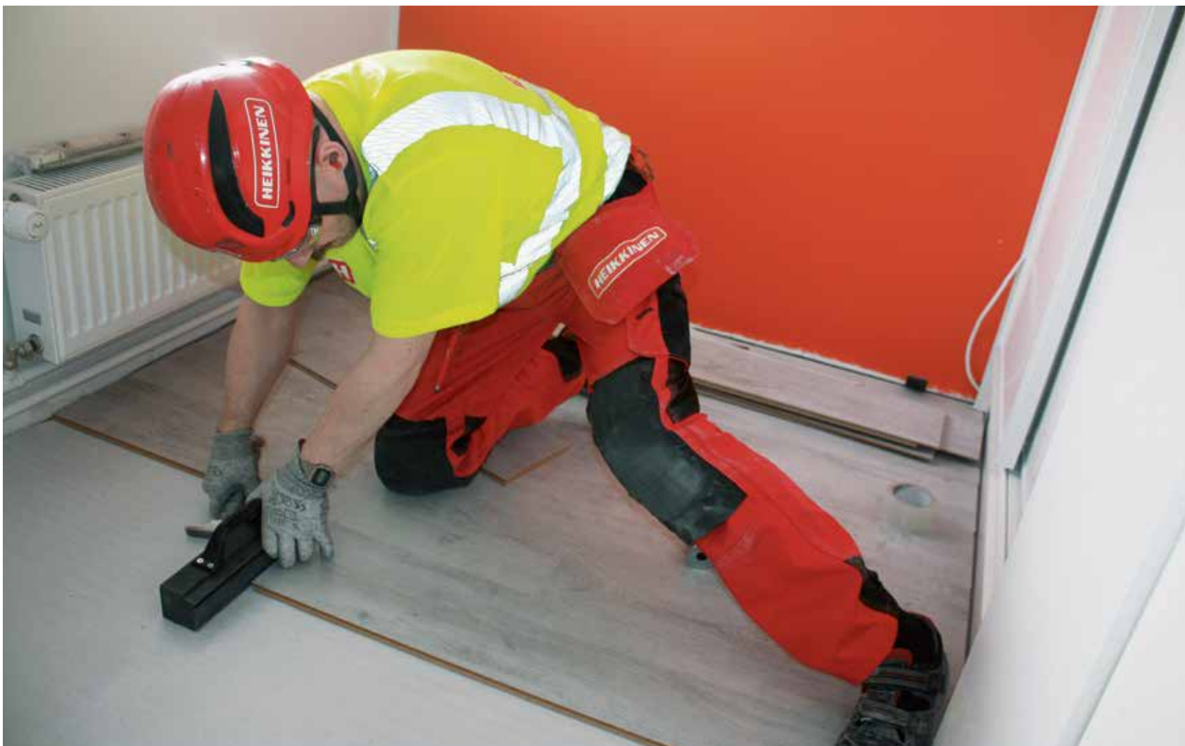
Suurin osa päivästä menee polvillaan. Tässä näyte venymistaidoista.