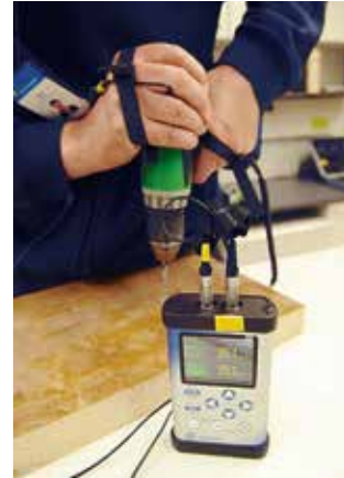
Tärinäarvo mitataan kiihtyvyytenä metriä sekunnissa

sesta, jotka ovat yhteisiä kysymyksiä työpaikoilla alasta riippumatta.