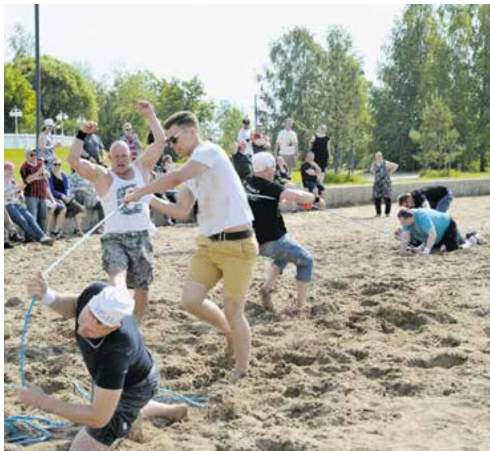
Osasto 007 vei tällä kertaa köydenvedon mestaruuden.