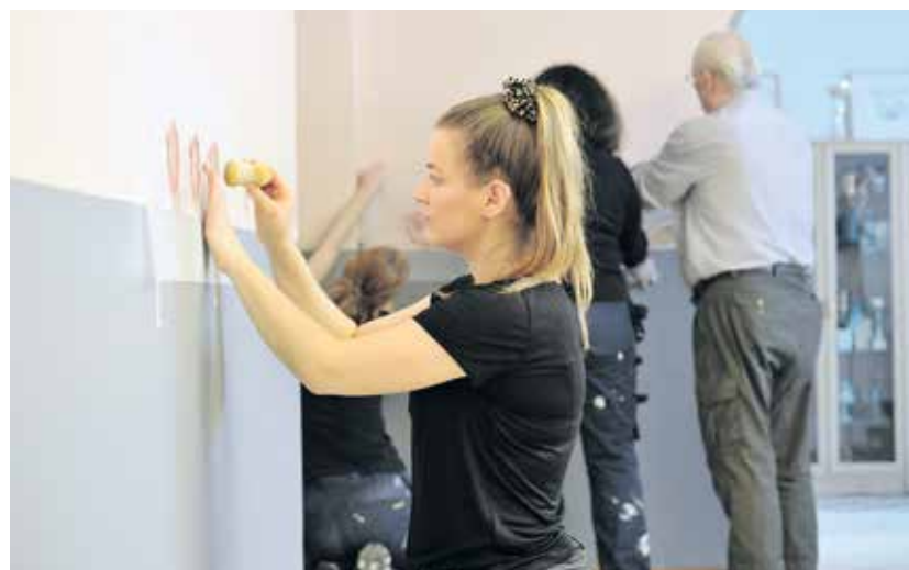
Annu Lehtiselle Tiimituvan maalauskeikka on jo toinen harjoittelupaikka.

Pintaremontti toteutettiin todella nopeasti. Ideasta valmiiseen lopputulokseen meni vajaa kuukausi. Opiskelijoiden työrupeamaan oli varattu 3 viik-