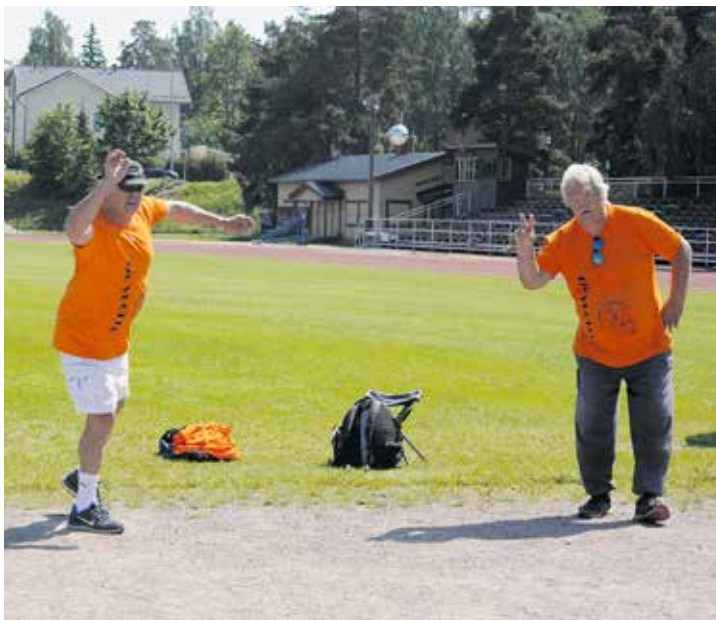
Petankki-pelissä tarkka käsi, silmä ja maltti ovat valttia.