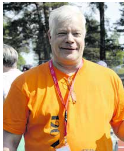
Osasto oli teettänyt osanottajille myös komeat teepaidat juhluvuoden kunniaksi.