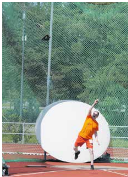
Lestinheitto on putkimiesten kuninkuuslaji. Hankalan muotoista, noin 1,5 kilogrammaa painavaa lestiä heittäessä tyyli on vapaa.