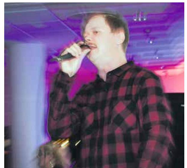
Talonpoika Lalli kertoo, miten se on.