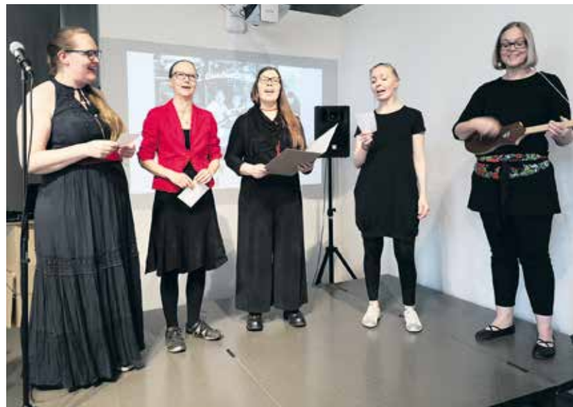
Näyttelyn avajaisissa klassikkobiisi Työmiehen lauantai kuultiin Rahvaan laulu -bändin kuoroesityksenä.

- Uskoisin, että näyttely voi houkutella paikalle sellaisiakin ihmisiä, jotka eivät niin välitä museoista. Meillä kaikilla on jonkunlainen suhde alkoholiin, käytti sitä tai ei, Lahtinen sanoo. ■