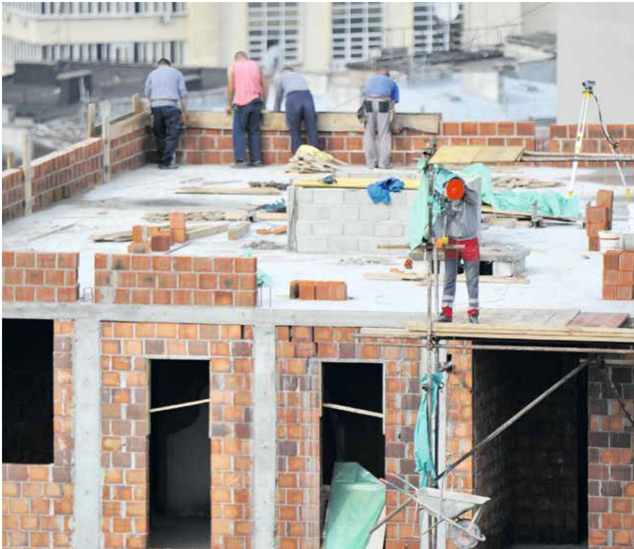
KUUKAUDEN KUVA Paikka: Belgrad, Serbia Aika: Kesäkuu 2019