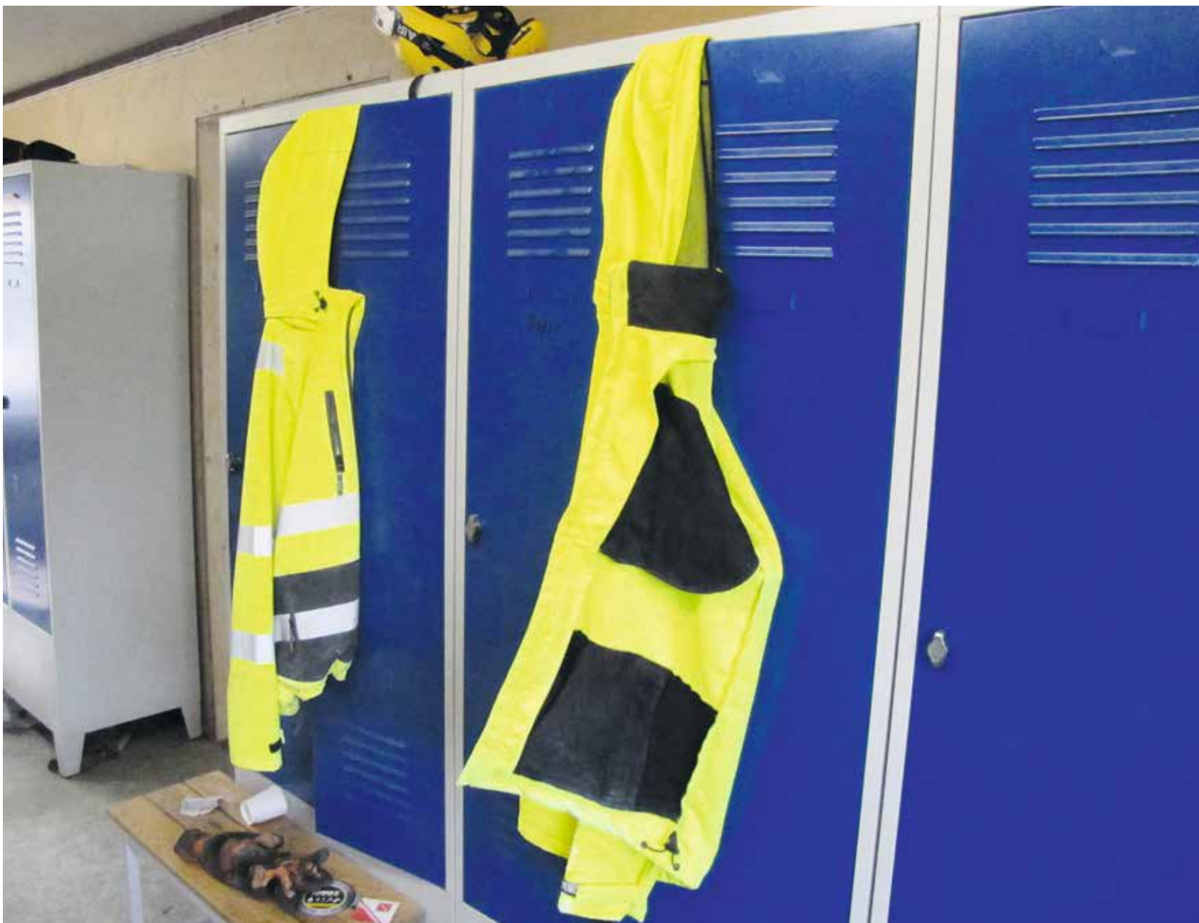
Vain kourallinen duunareita on laittanut haalarit naukaan ja vaihtanut puvun päälle tultuaan valituksi eduskuntaan.