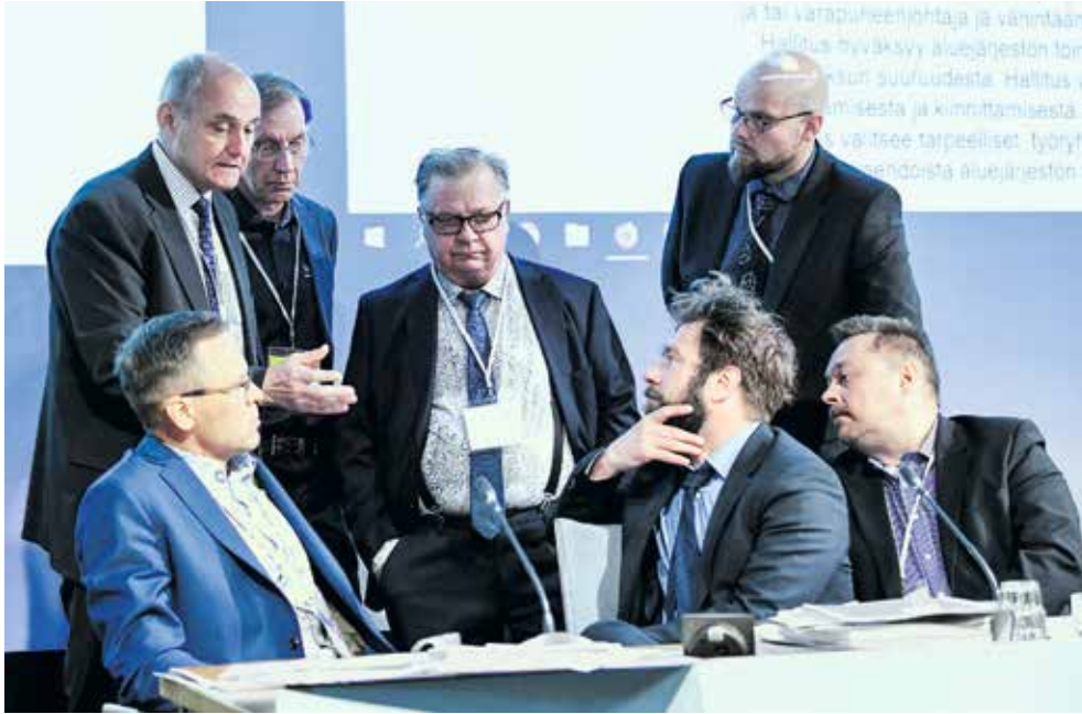
Menettelytapavaliokunta sai välillä visaisia pulmia pohdittavakseen.