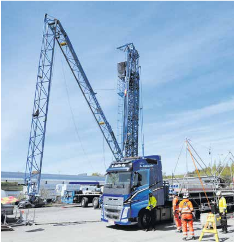
Elementtien purkupaikan turvallisuuteen pitää kiinnittää huomiota.

maa, samoin erillinen nostosuunnitelma, Heinonen muistuttaa.