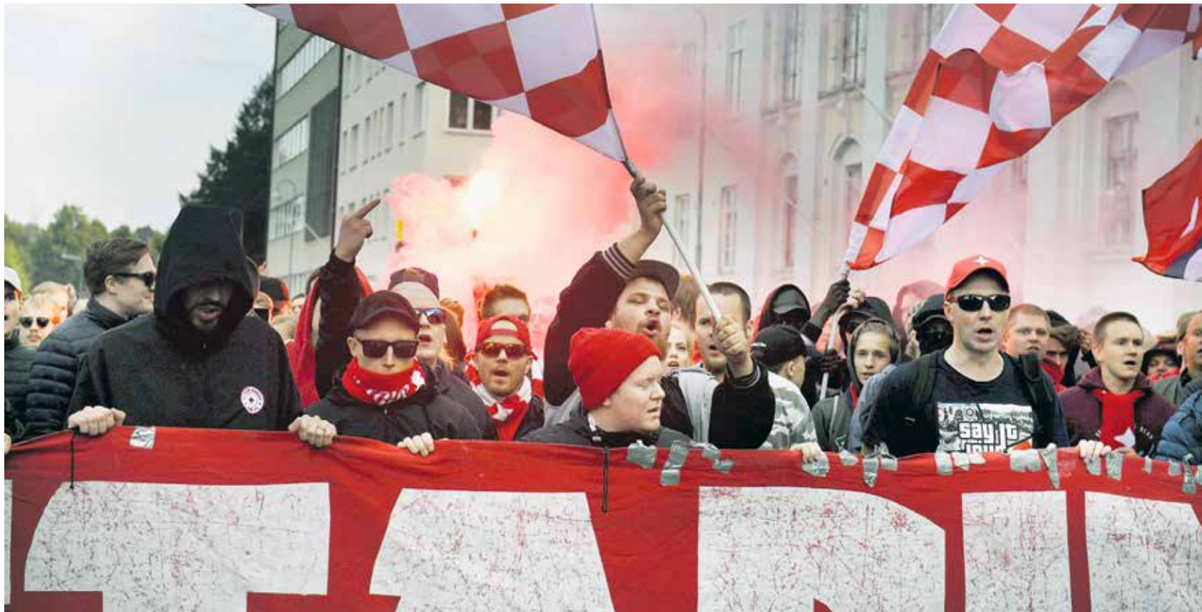
HIFK:n kannattajat suhtautuvat intohimoisesti seuraansa. He eivät innostuneet sen myymisestä.