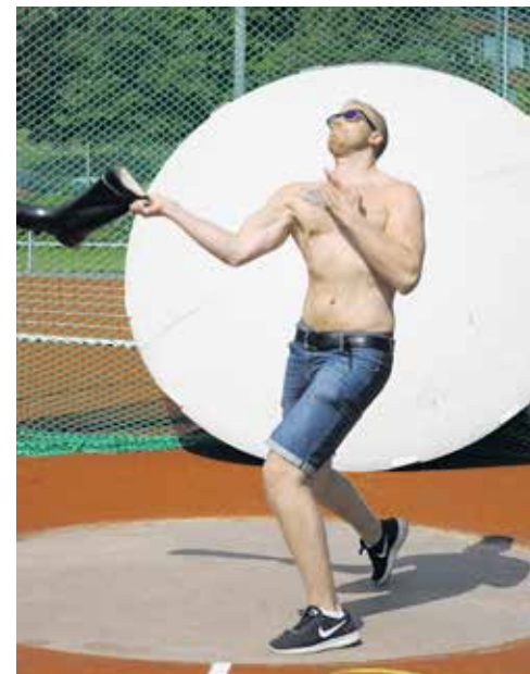
Tuulenpuuskissa kumisaappaan heittokaan ei ole ihan niin helppoa, kuin voisi kuvitella.