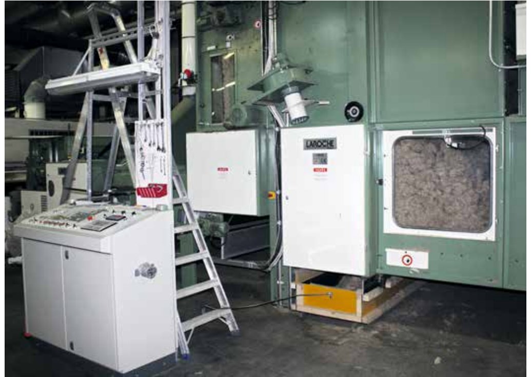
Tuotantoprosessin alussa kuidut "avataan". Ilmakarstaamisessa rakenteesta tulee kimmoista ja joustava.