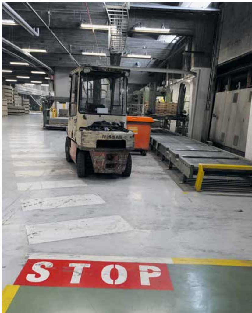
Tehdas saa kehuja työturvallisuuden kehittämisestä. Stop-merkin kohdalle on pysähdyttävä.