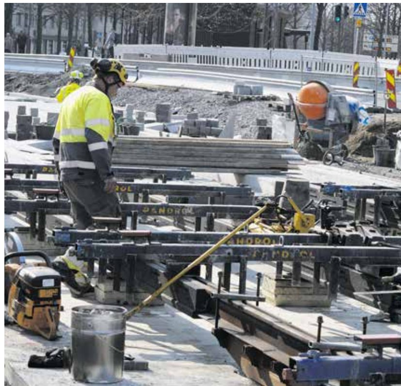
NRC Group Finlandin porukat sovittavat raiteet paikalleen, kun pohjat on tehty.

– Viime mittauksessa esimerkiksi yhdellä henkilöllä oli puutteita suojavausteissa, kulkureiteissä on ollut puutteita ja aitojen joukossa on ollut rikkinäisiä kappaleita. Sellaiset pyritään poistamaan heti ja korvaamaan uusilla, sillä muuten työmaasta tulee