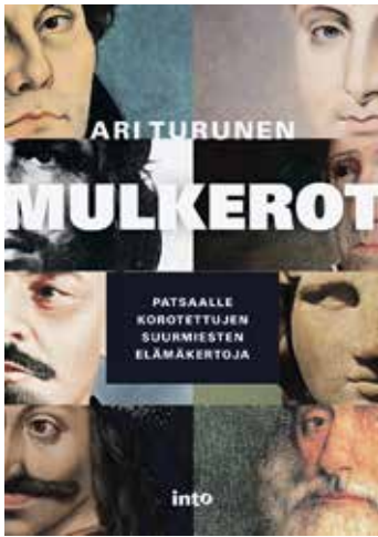
Ari Turunen: Mulkerot. Patsaalle korotettujen suurmiesten elämäkertoja. Into Kustannus 2019.