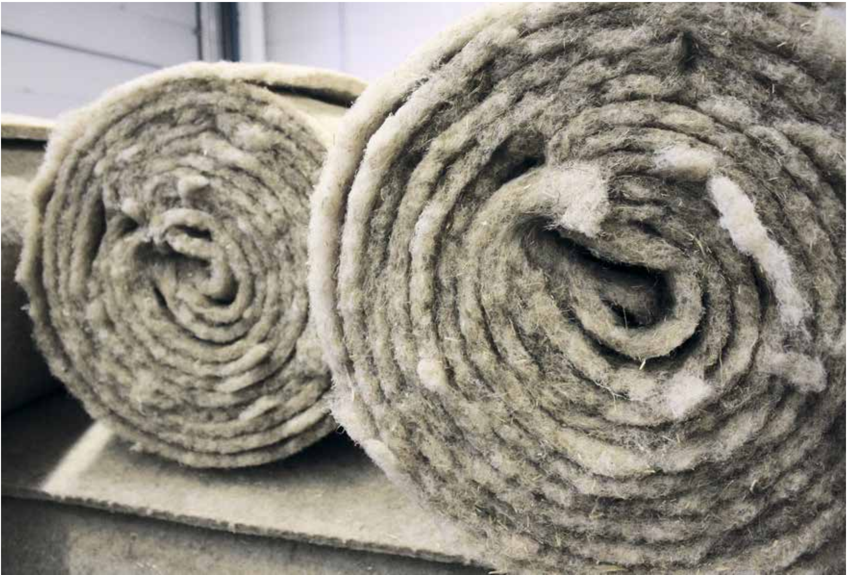
Pellavakuidusta valmistetut eristeet ja eristenaugat hengittävät. Moni miettii nykypäivänä rakennusmateriaaleja uusiutuvuuden sekä terveen sisäilman kannalta.