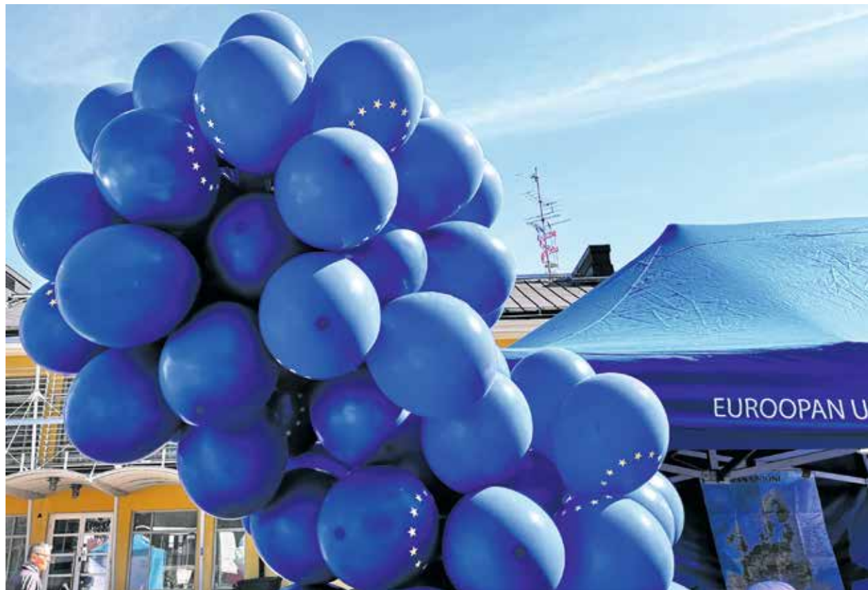
Helsingin Kampin Narinkkatorilla vietettiin Eurooppa-päivää 9.5.2019. Se toimi samalla komeana avauksena EU-vaalikampanjoinnille.

Euroopan työvoimaviranomaisen perustaminen tulee helpottamaan ra-