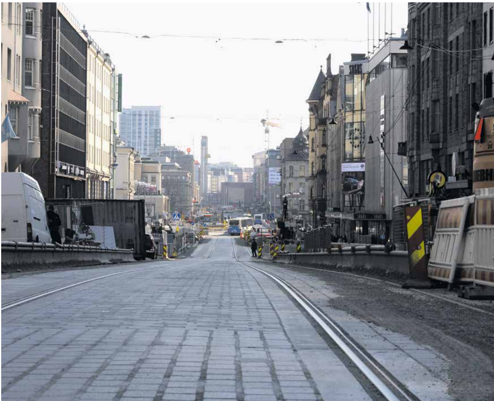
Tampereen Hämeenkatu käy läpi melkoista myllerrystä, kun ratikkakiskoja vedetään.