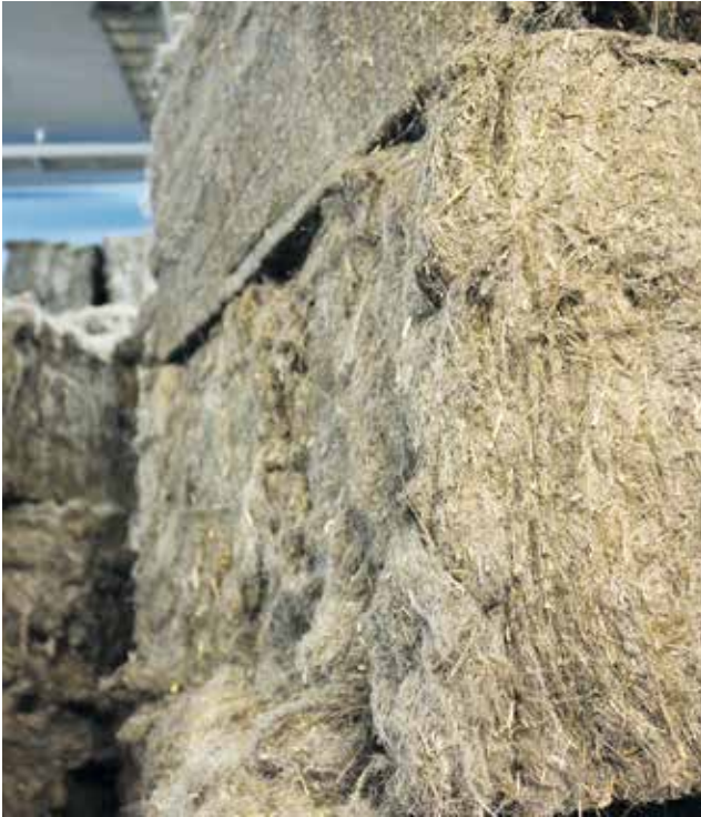
Raaka-ainetta valmiina prosessiin.