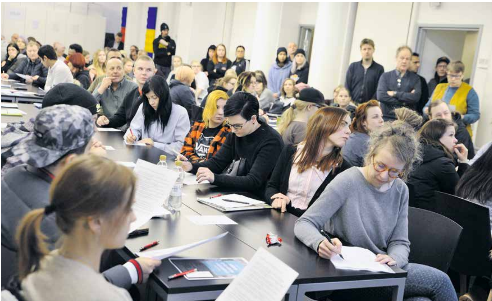
Rakennusliiton ensimmäisille rekrytointipäiville osallistui lähes 400 opiskelijaa.