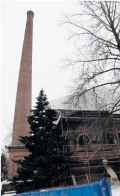
Kahdeksankulmainen savupiippu kohoaa korkeuksiin paperitehtaan vanhan pannuhuoneen vieressä. Se on ainoita Tampereen keskustan tehtaiden savupiippuja, joka on jäänyt entisestä "piippumetsästä" jäljelle.

Suurimmillaan työmaan vahvuus on 20 työntekijää. Hyrkkönen on siitä erikoinen rakennusliike, että sillä on oma talotekninen osasto, joten putki-, sähkö- ja ilmastointiasentajat ovat omasta takaa.