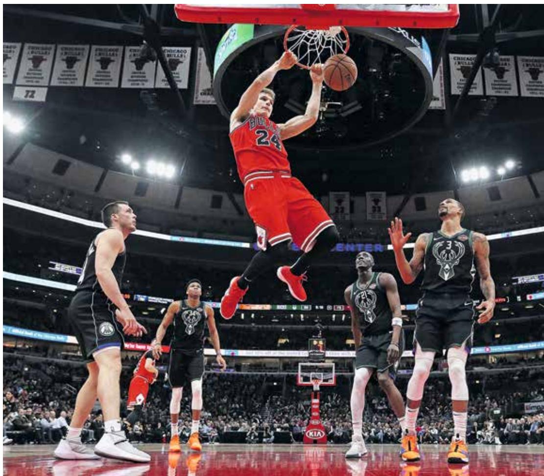
Lauri Markkanen donkkaamassa ottelussa Milwaukee Bucksia vastaan.

Helmikuussa Lauri Markkanen oli hurjassa viireessä NBA-parketeilla. Kun hän noteerasi viidessä perättäisessä ottelussa vähintään 20 pistettä ja 10 levypalloa, jyvaskyläläinen pääsi lähelle Michael Jordanin ja Scottie Pippenin tekemiä Chicago Bullsin seuraennätyksiä. Ottelussa Boston Celticsiä vastaan Markkanen ja Zach Lavine, Bullsien toinen johtava pelaaja, ylsivät molemmat 35 pisteeseen. Se oli ensimmäinen kerta sitten vuoden 1996, kun kaksi Bulls-pelaajaa onnistuu siinä saman ottelun aikana. Edelliset onnistujat olivat tietenkin Jordan ja Pippen. On jo itsessään uskomaton saavutus 21-vuotiaalle urheilijalle päästä kyseisten nimien rinnalle missään tilastoissa. Vielä uskomattomampaa siitä tekee se, että Markkanen on kotoisin Suomesta.