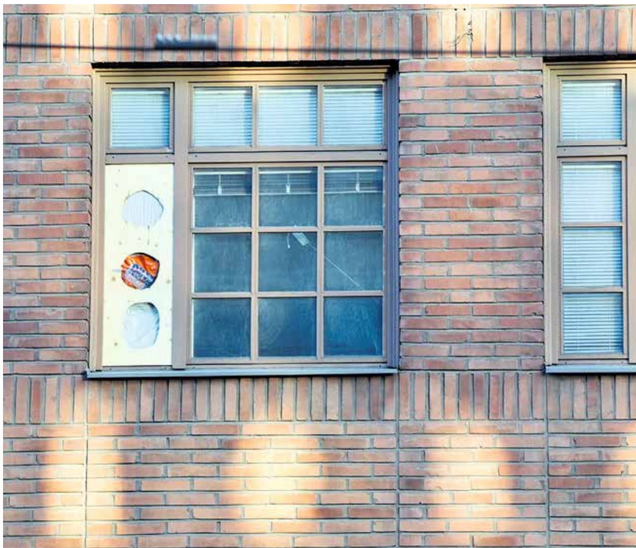
KUUKAUDEN KUVA Paikka: Hakaniemi, Helsinki Aika: Helmikuu 2019