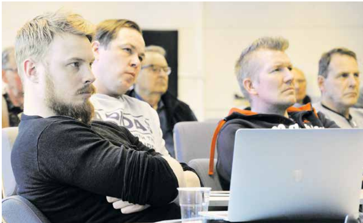
Muoraus- ja laatoitusalan hinnoittelussa on jatkossakin kehittämistä. Valmiiksi sitä ei saada koskaan.

Järvinen muistutti muurareita uudesta koulutussopimuksesta, joka tuo ammattikoululaisia harjoittelemaan työmaille aikaisempaa enemmän ja ai-