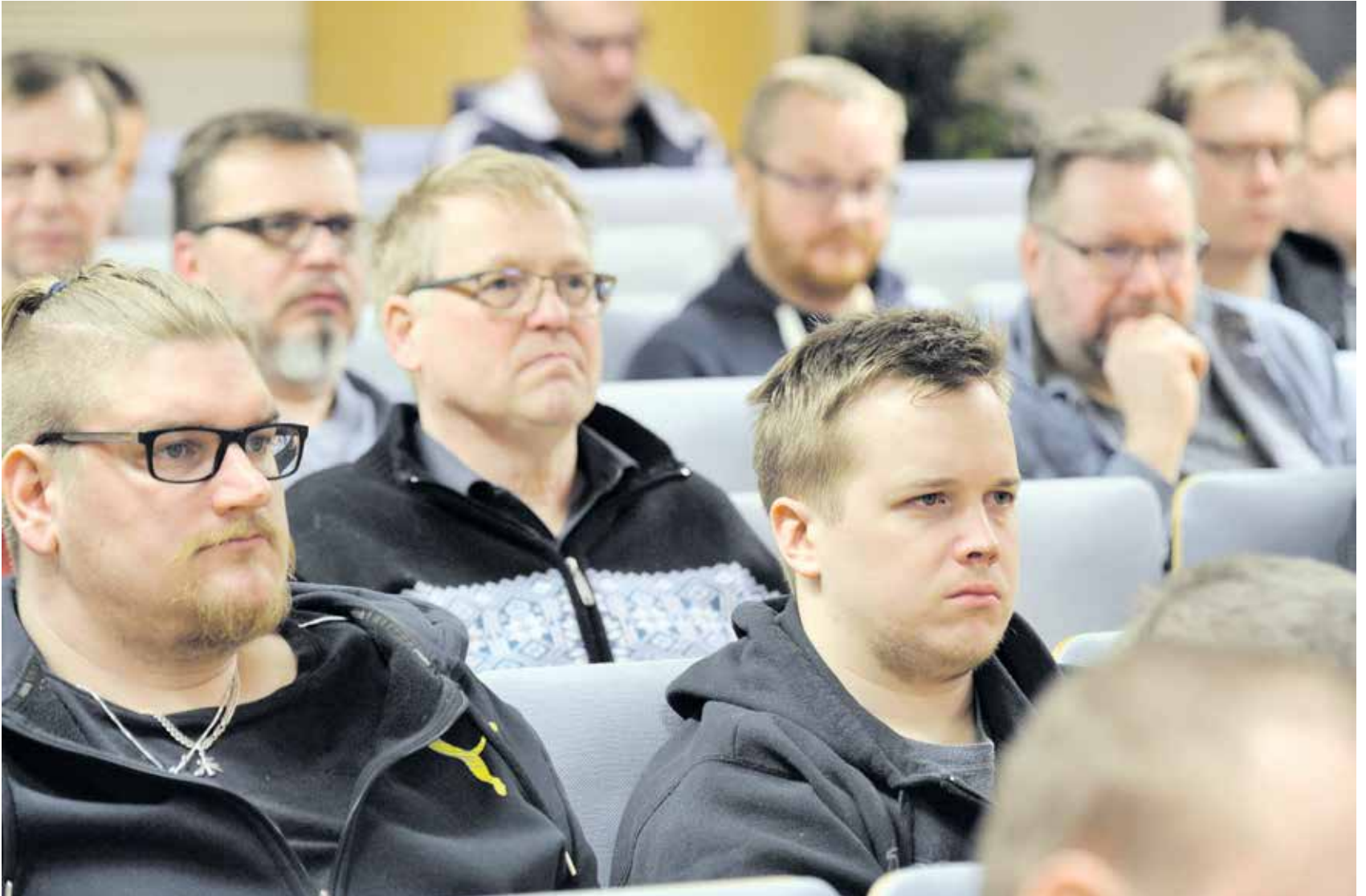
Työmarkkinoiden haasteet ja mahdollisuudet -keskustelu veti ilmeet välillä vakaviksi.