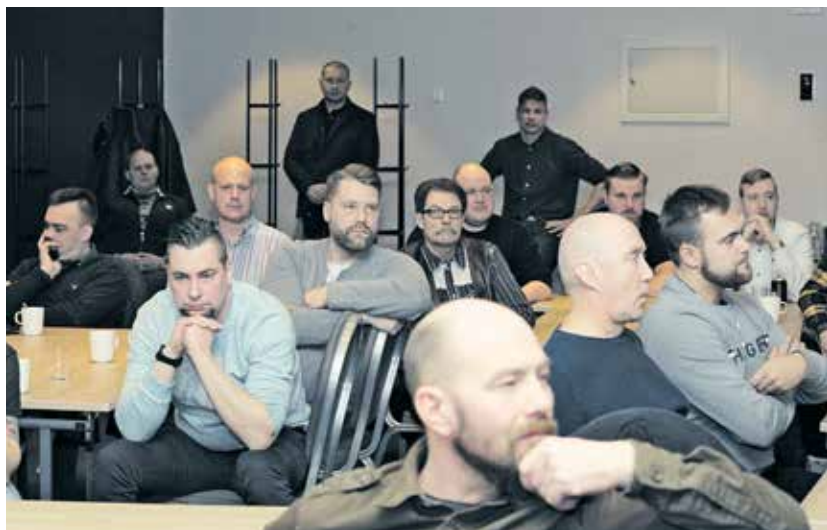
Kuljettajia mietitytti, miksi STM ajaa työturvallisuutta huonommaksi.

On siis pystyttävä kehittämään uudenlaisia malleja sen turvaamiseksi, että maasta löytyisi edelleen ammattitaitoisia kuljettajia. Yksi esimerkki tästä on alan uusi tulokas, Turun Nosturikoulutus Oy.