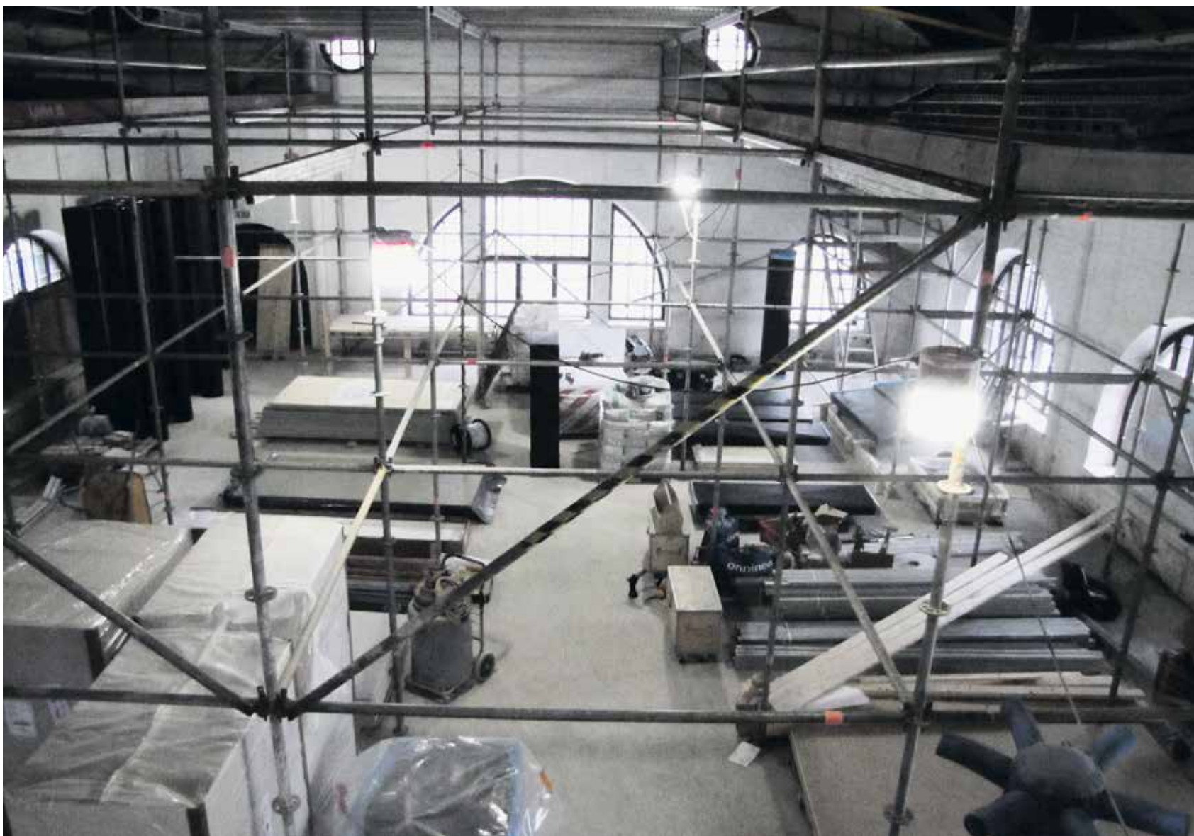
Ensi kesänä näissä tiloissa raikaa elävä musiikki ja tarjoilu pelaa.