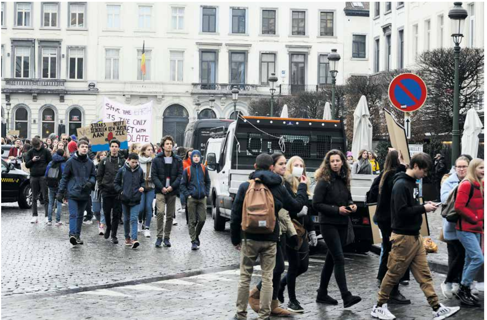
Brysselissä kuohuu nyt monellakin tapaa. Tuhannet paikalliset koululaiset kerääntyvät joka torstai Place De Luxembourgille osoittamaan mieltään ilmastonmuutosta vastaan. He vaativat poliitikoilta konkreettisia toimia.