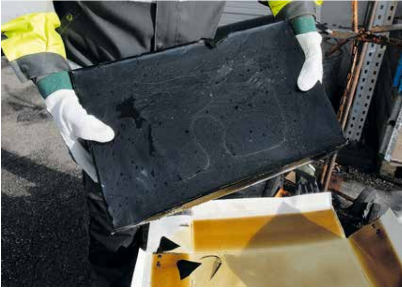
Kumibitumi sisältää bitumia ja SBS-elastomeeria, joka on kumia.

– Kylpyhuoneiden vedeneristeissä ei ole kovin vaarallisia aineita. Kuumassa katku kuitenkin voimistuu ja tuntuu. Joskus laitetaan puhaltaja ovelle, että saadaan ilma vaihtumaan.