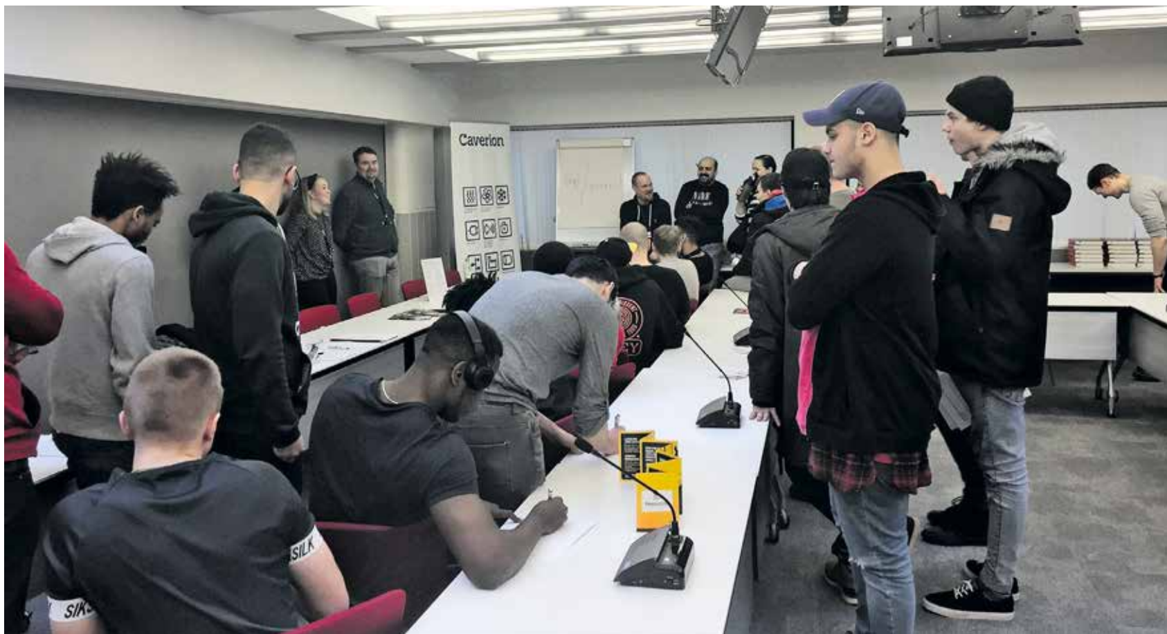
Caverionin esittelypisteessä täytettiin yhteystietokaavakkeita mahdollista työhaastattelua varten.

Opiskelijoilta, opettajilta ja yrityksiltä tullut palaute oli erittäin myönteistä. Hyvä meininki näkyi myös yritysesittelypisteissä, jossa parhaat esiintyjät saivat opiskelijat miettimään jopa ammatinvaihtoa rakennusalan sisällä.