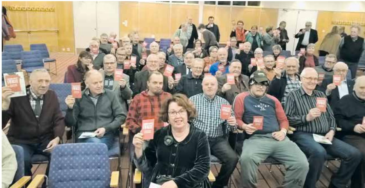
Punainen kortti FIFALLE! Kansainvälinen jalkapalloliitto ei ole ottanut vastuuta, vaikka seuraavien, Qatarin järjestämien jalkapallon MM-kisojen rakennustyömailla kuolee yksi työntekijä joka toinen päivä.

– Ensin kiellettiin julkiselta toimialta leikkaamiset aluesairaaloissa. Näin tehtiin, vaikka niissä oli kokemusta ja pätevä henkilökunta. Sitten pitäisi säätää laki, joka sallisi leikkaukset yksityisille jättifirmoille. Kun yksityisillä sairaaloilla ei olisi kallista päivystysvastuuta, ne voisivat toimia julkista edullisemmin ja niiden teke-