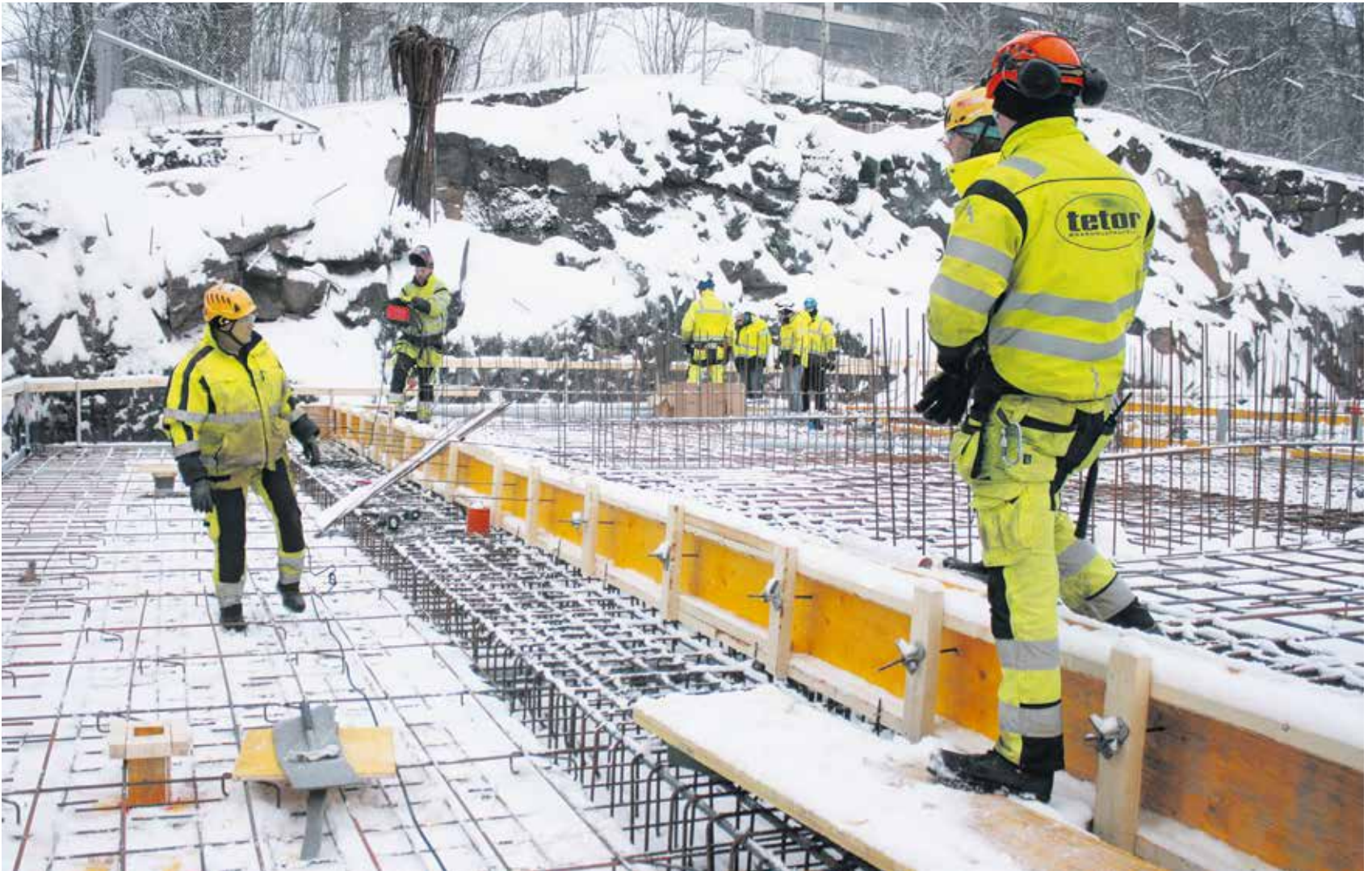
Linnankadulle nousee As Oy Minerva, jonka rakennustyöt aloitettiin vuoden 2018 kesällä.