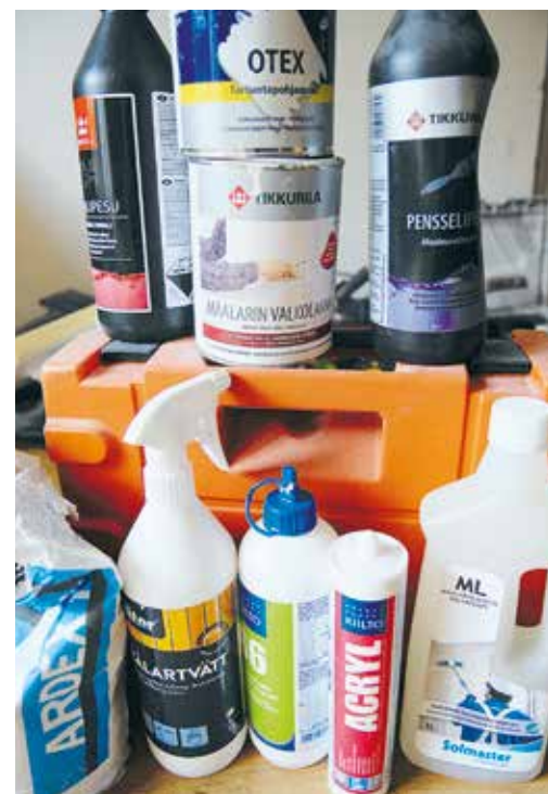
Työmaalla on runsaasti kemikaaleja, joiden yksittäinen ja yhteinen vaikutus on syytä selvittää altistumisen kannalta. Raja-arvot ja pitoisuusmittaukset ovat yksi lähtökohta, toinen käyttöturvallisuustiedotteiden lukeminen. Jos arvioiminen on vaikeaa, apua saa työterveysluolasta.

Eri EU-maiden HTP-arvojen sitovuus vaihtelee. Suomessa, Portugalissa ja Kroatiassa niihin suhtaudutaan löysemmin kuin monessa muussa maas-