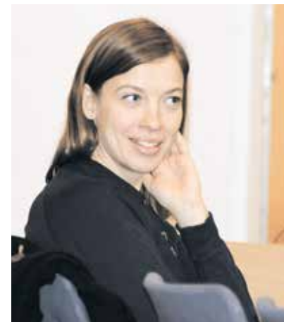
Li Andersson pitää työllisyyden parantamista sekä heikompiensaisten aseman parantamista seuraavan vaalikauden tärkeimpinä tavoitteina.