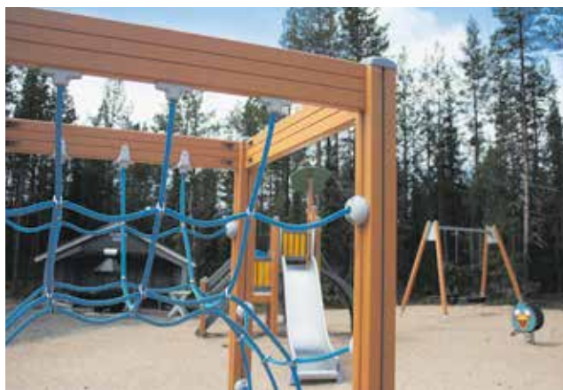
Tämä leikkikenttä syntyi viime kesänä osasto 200:n talkootyönä.

– Myös paikalliset yrittäjät ovat mielellään mukana. Esimerkiksi kun tarvitaan soraa yhteiseen hankkeeseen, niin sanovat, että osta minun laskuuni. Ehkä tarvitaan vain tällaisia kylähulluja organisoimaan hankkeita.