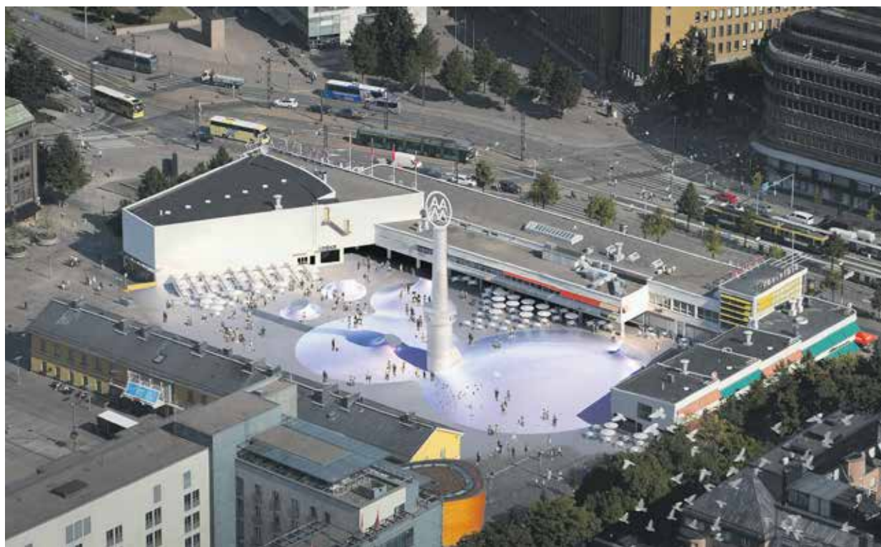
Amos Rexin kaarihovi-ikkunat mahdollistavat sijainnin hahmottamisen myös alhaalta katsottuna.

– Metro on ollut iso päähkinä purtavaksi. Meillä on sekuntiaikataulu jolloin pystymme tekemään räjäy-