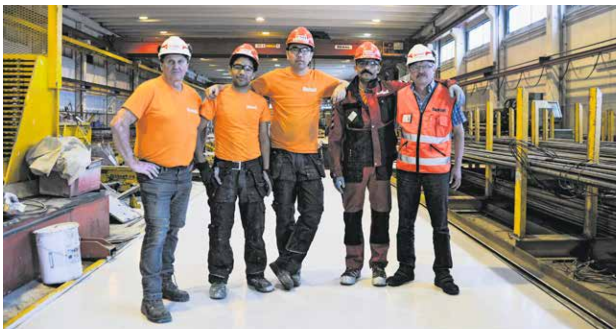
Betsetin tehtaalla puhalletaan yhteen hiileen, oli tausta mikä tahansa.

Viime vuoden lopusta Suomessa oleskelleet miehet toivovat vain rauhaisaa elämää ja että voisivat olla osa suomalaista yhteiskuntaa.