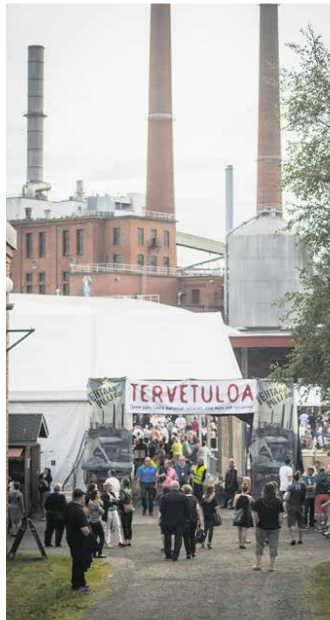
Tapahtuma järjestettiin aivan Valkeakosken paperitehtaan vieressä.

Työväenmusiikki voi hyvin, vaikka perinteiset musiikinmuodot saavatkin uusia kantaottavia haastajia. Kiitos Valkeakoski ja järjestäjät hienosta tapahtumasta. Paperitehtaan varjossa tavataan. ■