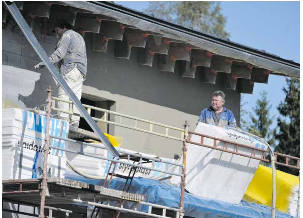
Putoamissuojaus on yhä etenkin pienkohteissa rempallaan.

Suomessa sattuu nykyään noin parikymmentä kuolemaan johtanutta työtapaturmaa vuodessa. Noin kymmenen viime vuoden aikana