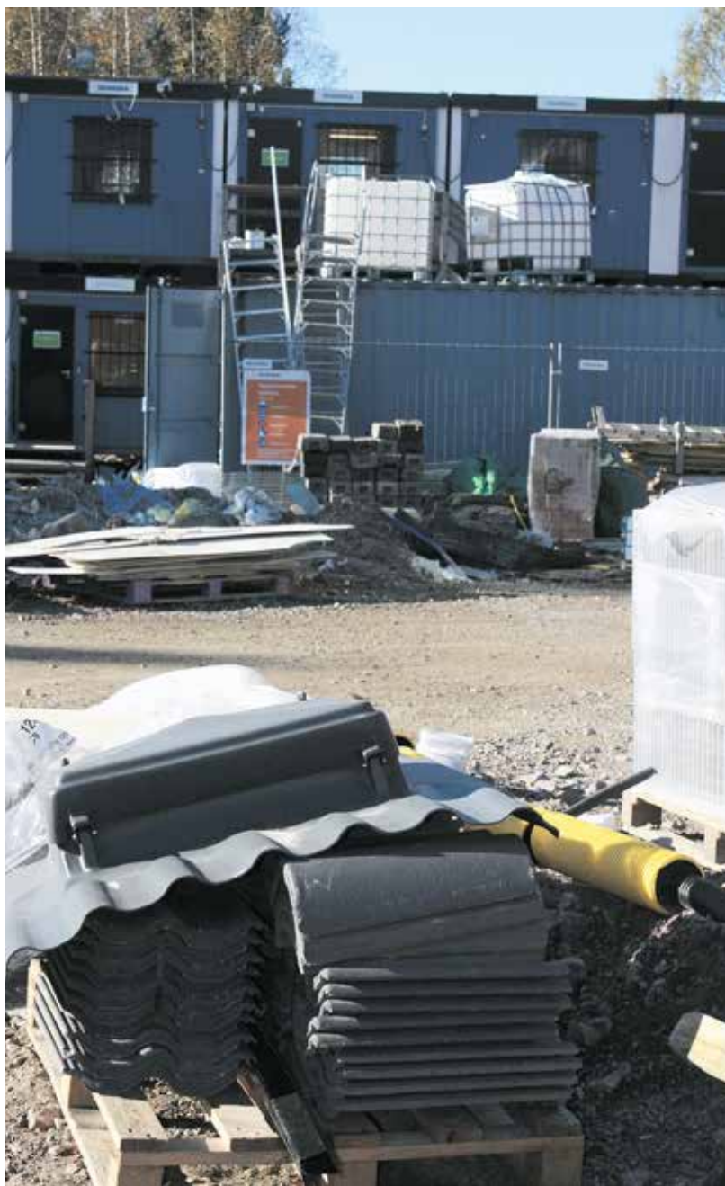
Kuninkaantammi nousee kortteli kerrallaan.

– Viher-suunnittelusta on tehty osa muita lupa-asioita ja koko rakennusprosessia alusta pitäen. ■