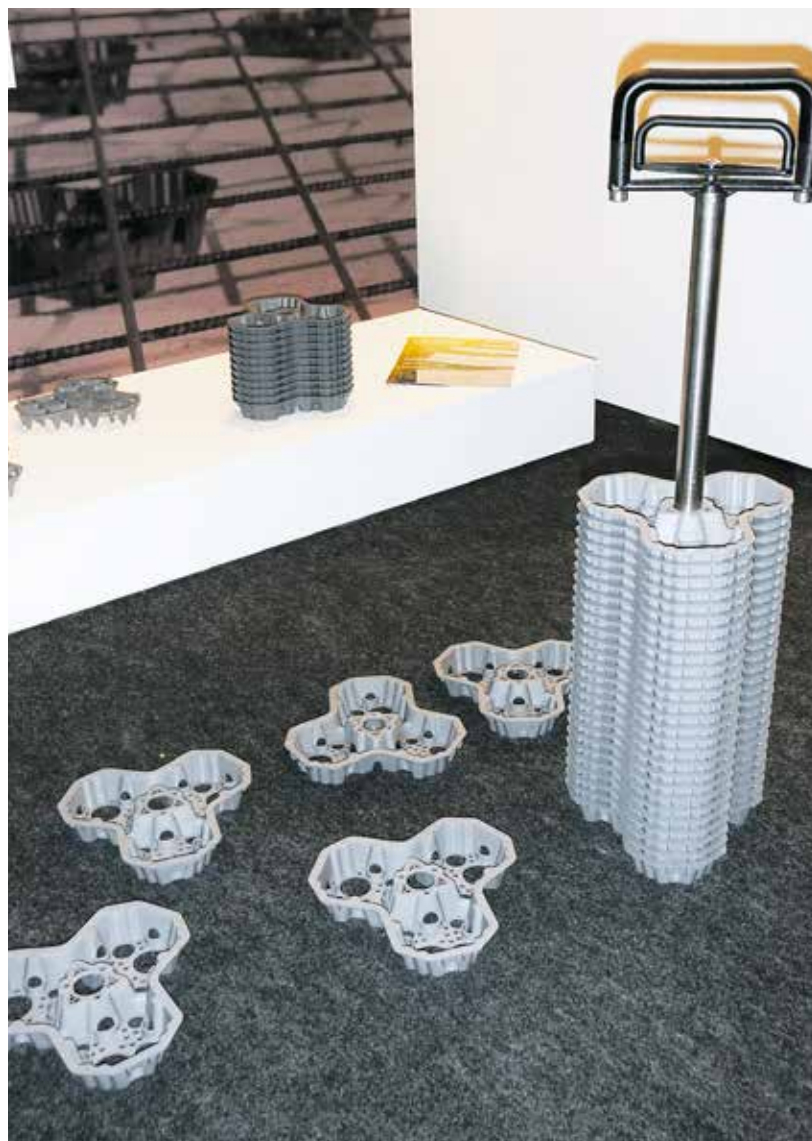
Munakennon ideasta alkunsa saaneet välitteet ja asennustyökalu.

työ tehdään todennäköisesti käsin. Jauhemaalauksen kiinnostavimpia sovelluksia ovat esimerkiksi sairaaloihin ja hoitolaitoksiin tehtävät hygieeniset pinnat. Jauhemaalain joukossa on hopeaa, jolla on useissa tutkimuksissa todettu olevan bakteereja tappavia ominaisuuksia. Muun muassa pelottava sairaalabakteeri MRSA poistuu tällä tekniikalla maalatuista pinnoista kuin heittämällä.