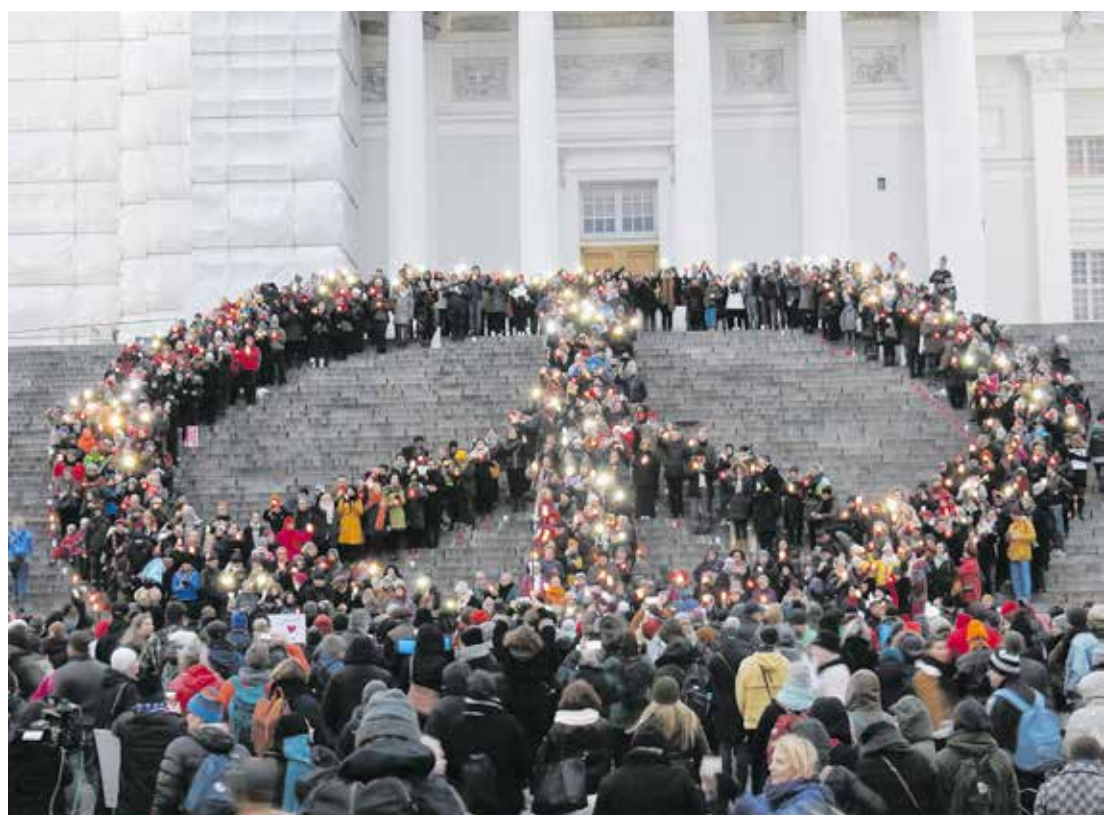
Rauhanmarssi päättyi Helsingissä Senaatintorille.

Syyriassa sisällissota on jatkunut jo viisi vuotta. Yli 430 000 ihmistä on kuollut Syyrian sodassa. Enemmän kuin puolet ihmisistä on paennut kodeistaan. ■