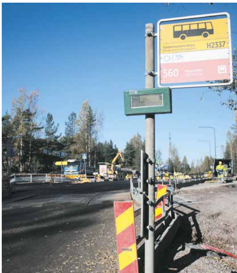
Kuninkaantammen alueen bussipysäkki; takana syntyy viemäri-infraa.