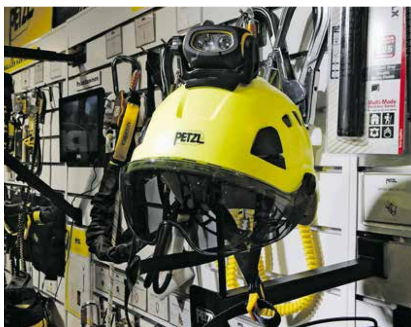
Halutuinta hottia; Pezlin kypärä tummalla lasilla. Huhu kertoo, että kun tumma lasi tuli markkinoille, alkoivat kirkaat lasit ”yllättäen naarmuuntua” työmailla. Jokainen rakentaja haluaa olla hävittäjälentäjän näköinen.

Välikkeitä menee yhdelle neliometrille noin 1,25 ja niitä on sekä pehmeälle (esim. eristepinta) että kovalle alustalle (esim. holvi). Välikkeet toimitetaan 50 kappaleen ”torneissa”.