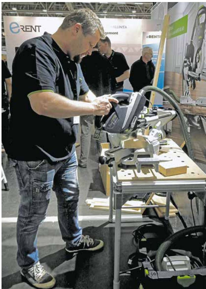
Kevyessä Festoolin jiirisahassa jiirikulma taipuu 60 asteeseen ja kallistuskulmaakin on molempiin suuntiin 47 astetta.