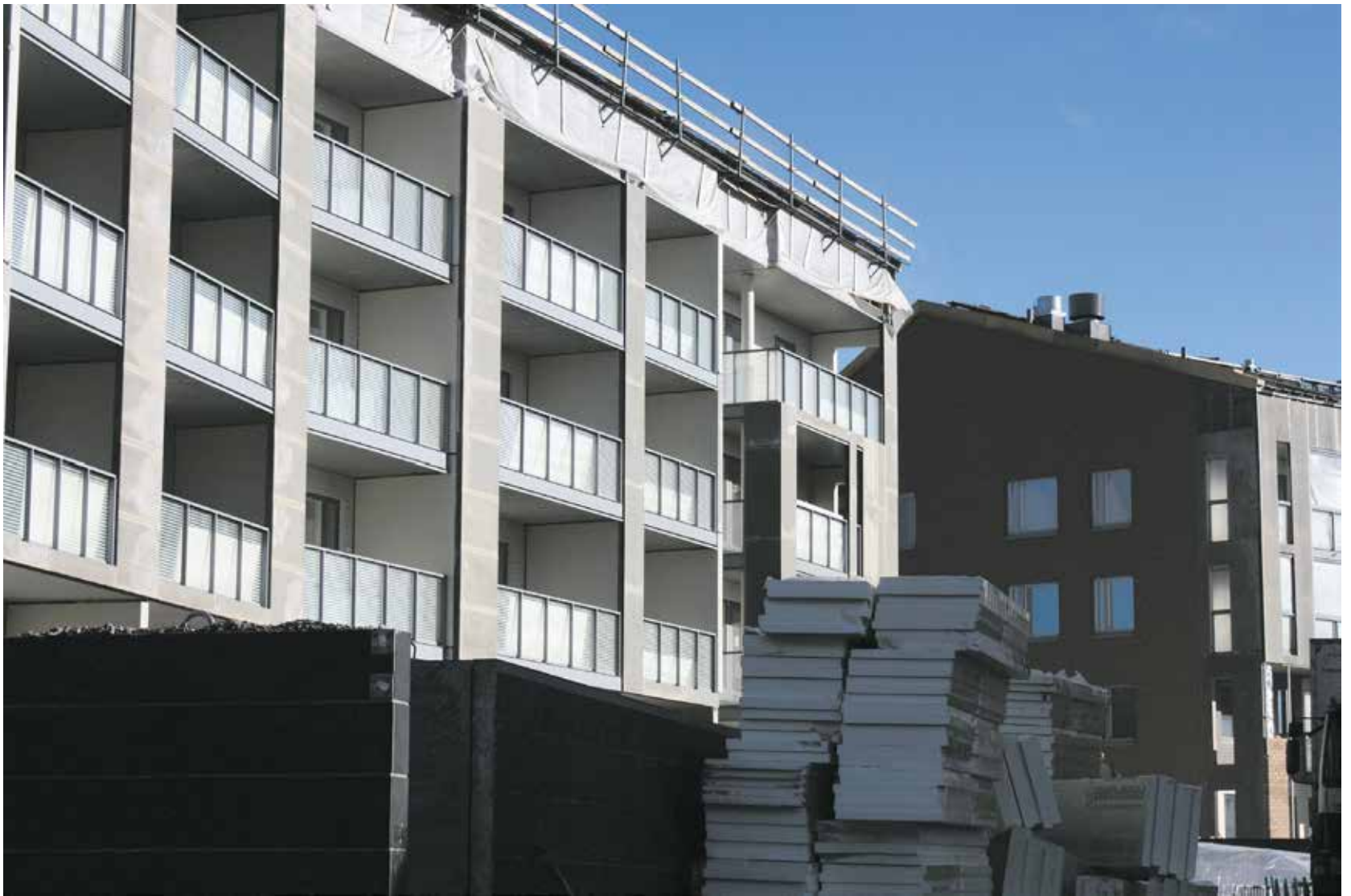
Skanskan asuntokohde Kuninkaantammessa saa ensimmäiset asukkaat marraskuussa.