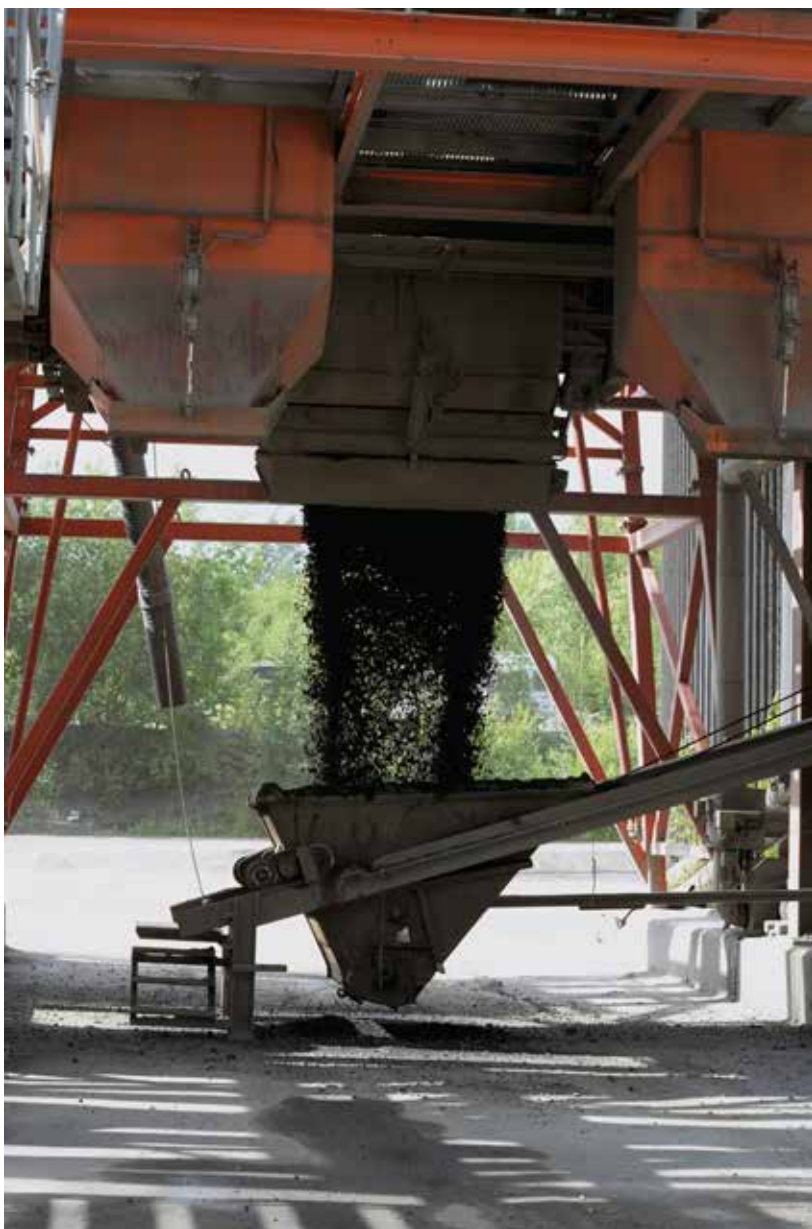
Tehtaassa on välttytty ylimääräisiltä seisokeilta. Kaikki pelaa kuten kuuluu.

läpi syvälle maahan, kunhan sitä nyt ei aivan nilkkoihin saakka ole. Melkoinen höyry asfaltoidessa silloin kyllä nousee.