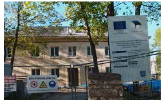
EU on tukenut jo vuosikymmeniä useita Viron rakennus- ja tiekohteita.

oli menossa isoja rekka-autoja. Myös kävellen ja polkupyörillä siltaa ylitti ihmisiä. Näkyi myös lapsiperheitä. Toisella puolen jokea on aivan rannan tuntumassa omakotiasutusta.