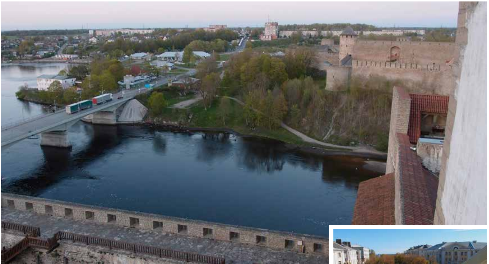
Iltayön näkymä Narvassa. Narvajoen rajasilta ja Viron ja Venäjän tulliaseman jonot.