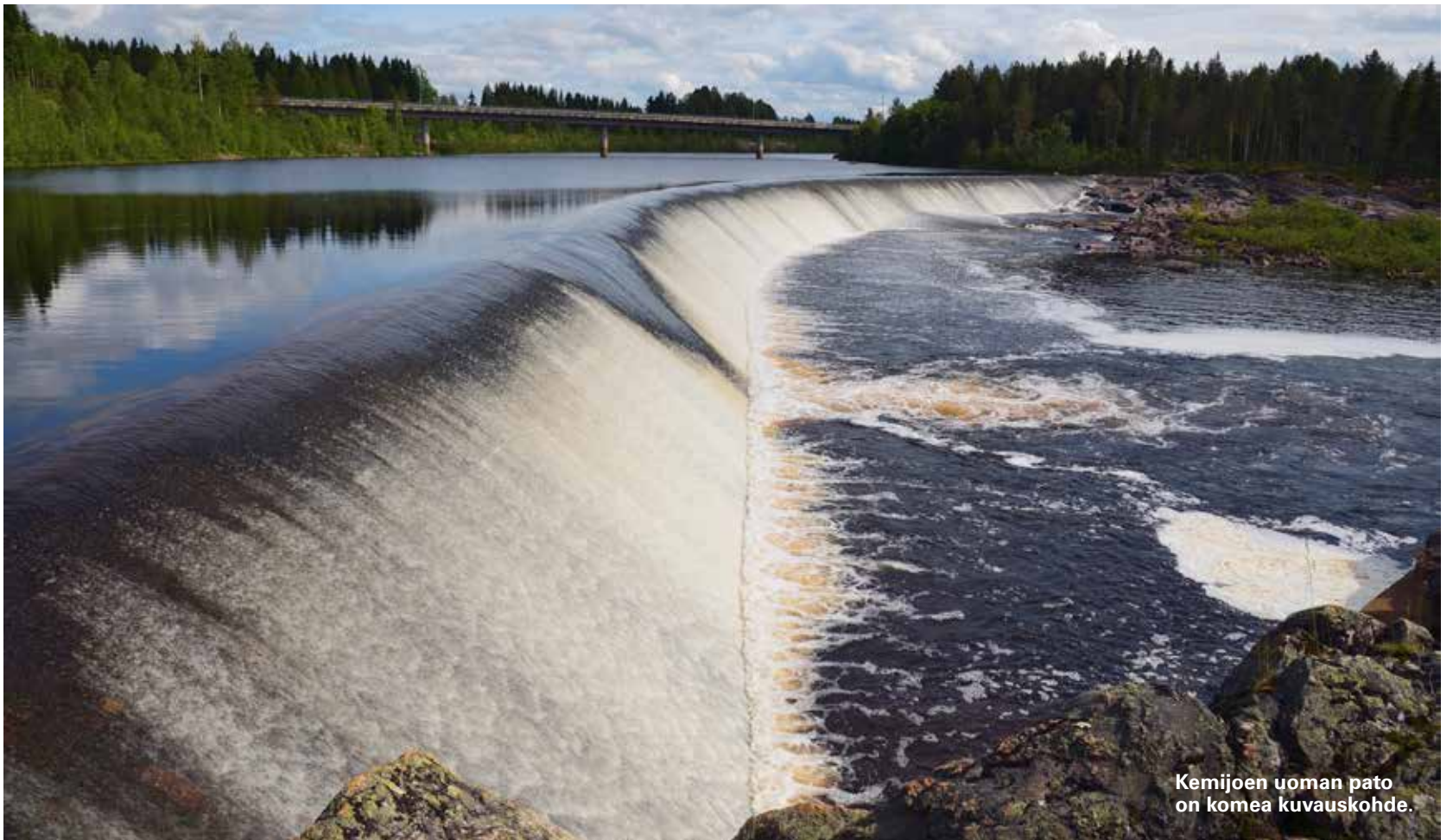
Kemijoen uoman pato on komea kuvauskohde.