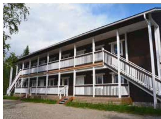
Hostelli Hullu Poron huoneistoissa on kaksi huonetta ja 48 neliötä.