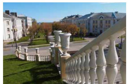
Sillamäen vankat kivitalot Neuvostoliiton ajoilta seisoivat tukevasti pystyssä. Kaupunki perustettiin vuonna 1947 uraaniteollisuuden tarpeisiin.

Narva on Viron itäisin kaupunki EU ja Naton ja Venäjän rajakaupunki. Katselin iltamyöhällä rajalla olevan sillan liikennettä. Molempiin suuntiin