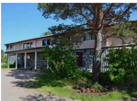
Ensimmäinen kerta hostellissa oli porukalle mukava kokemus. Kemijärven hostellissa yllätti yhteisöllinen tunnelma.

Rakennusliiton jäsenet saavat Suomen Hostellijärjestön hostelleista 10 prosentin alennuksen. ■