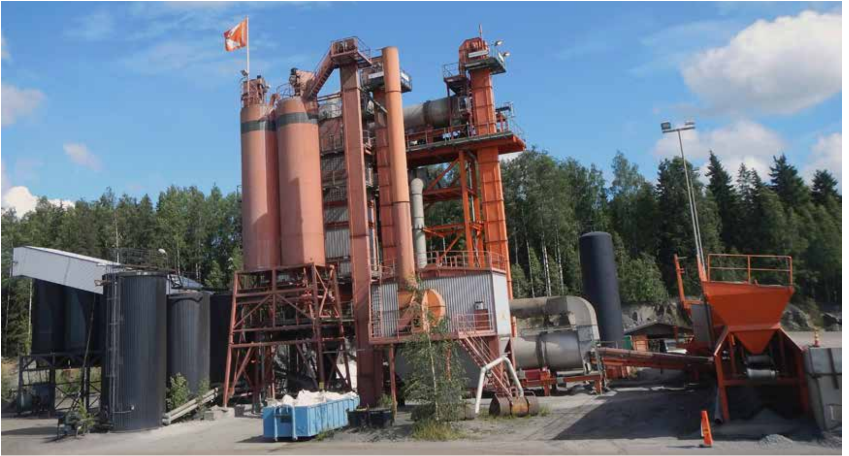
Valkeakosken asfalttiasema on mutkaisen tien päässä, keskellä maaseutua.