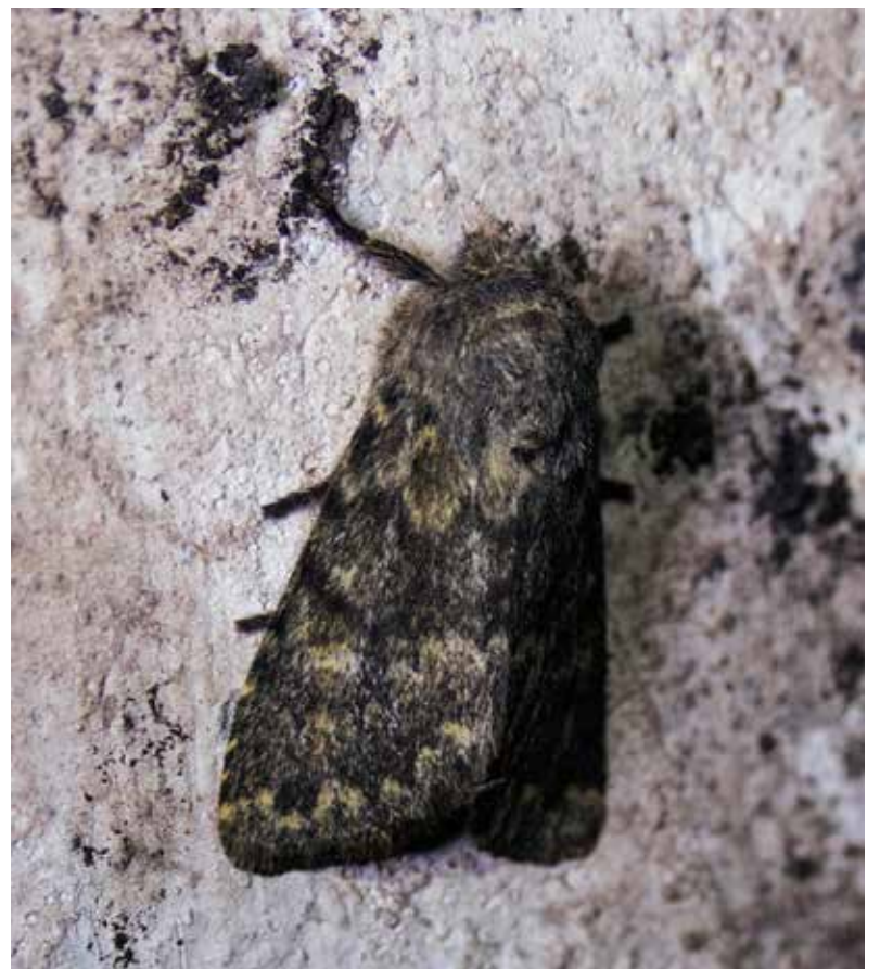
Loimuyökkönen ei taida olla maailman kaunein perhonen.

Päiväperhosista 70 prosenttia talvehtii toukkana ja 10 prosenttia kotelona. Aikuisena talvehtivat suruvaippa, nokkos- ja isonokkosperhonen sekä neito-, herukka-, ja sitruunaperhonen. Aikuistalvehtijat ovat ensimmäisenä ilmassa keväällä, suunnilleen huhtikuussa, jopa maa-