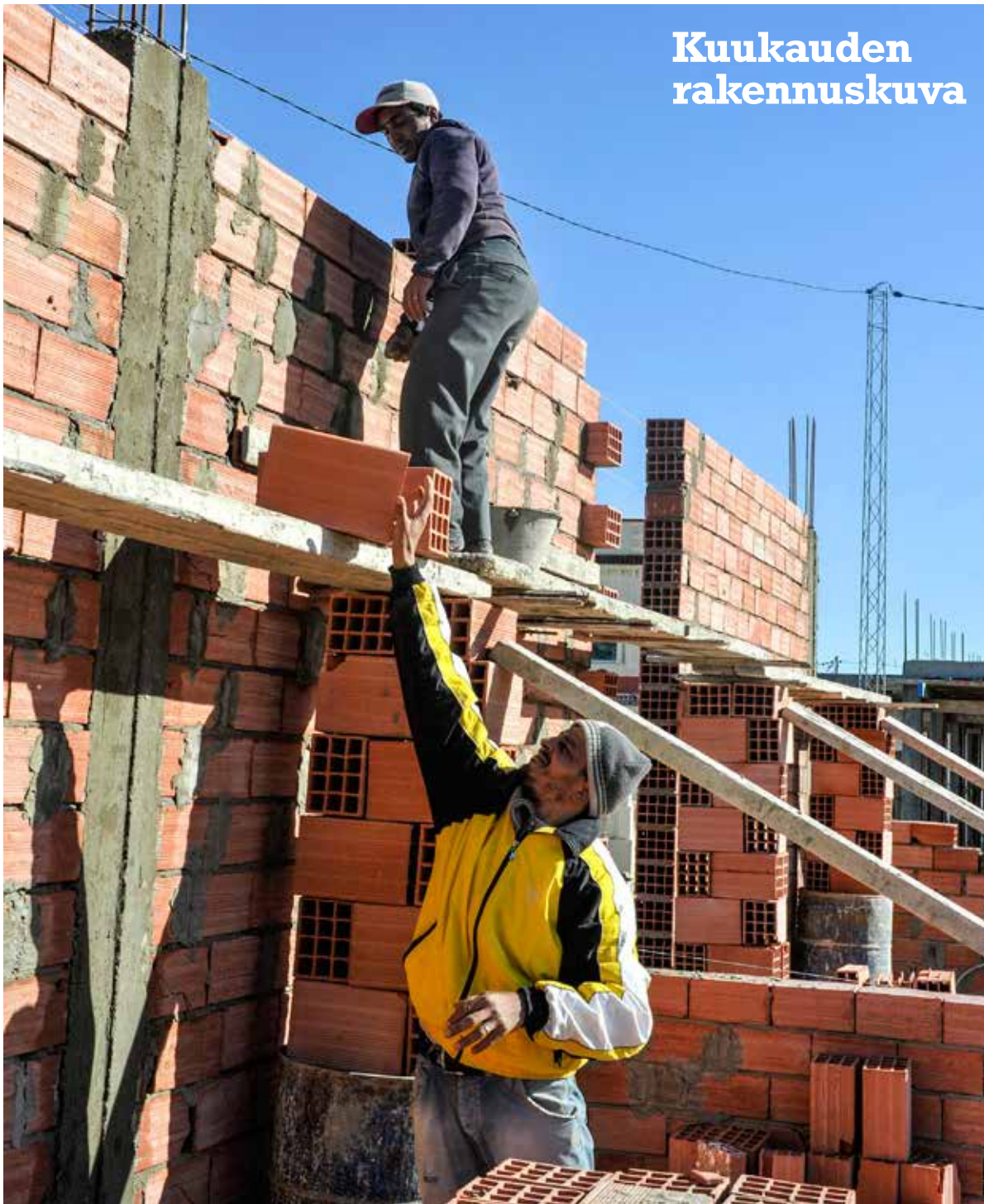
Kuvaaja: Maija Ulmanen Paikka: Qurbus, Tunisia Aika: Joulukuu 2014

Mitä? Niin kuin kuvasta huomaamme, ei työturvallisuus ole kaikkialla yhtä hyvässä jamassa kuin Suomessa, vaikka meilläkin on parannettavaa. Tunisialaiset rakentajat tiedostavat kyllä vaaratekijät, mutta rakennuttajat haluavat päästä mahdollisimman helpolla. Ihmishenki ei paljon paina rakennuttajan vaakakupissa. Työtä tehdään puutteista huolimatta hymy huulilla ja ammattitilpeydellä.