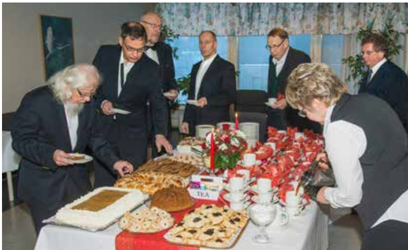
Pöytä oli pantu koreaksi Vuoksenniskan työväentalolla.