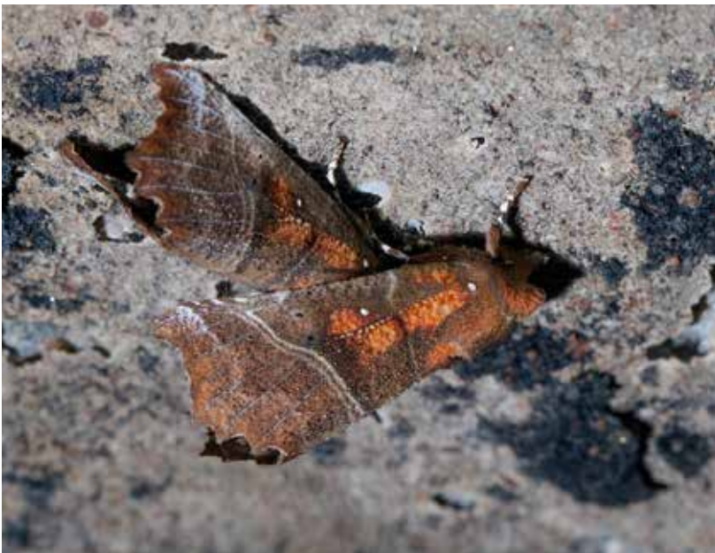
Liuskayökköset olivat samalla paikalla koko ajan.

liskuussa auringon kovasti paistaessa. Talvehtineilla on keväällä haaleat värit ja usein repalaiset siivet.