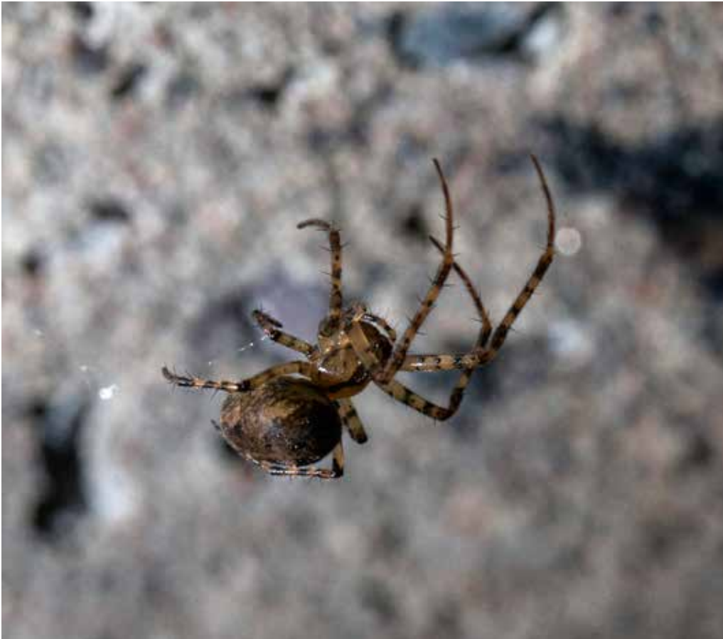
Komea onkaloaukokki huoneen seinällä.