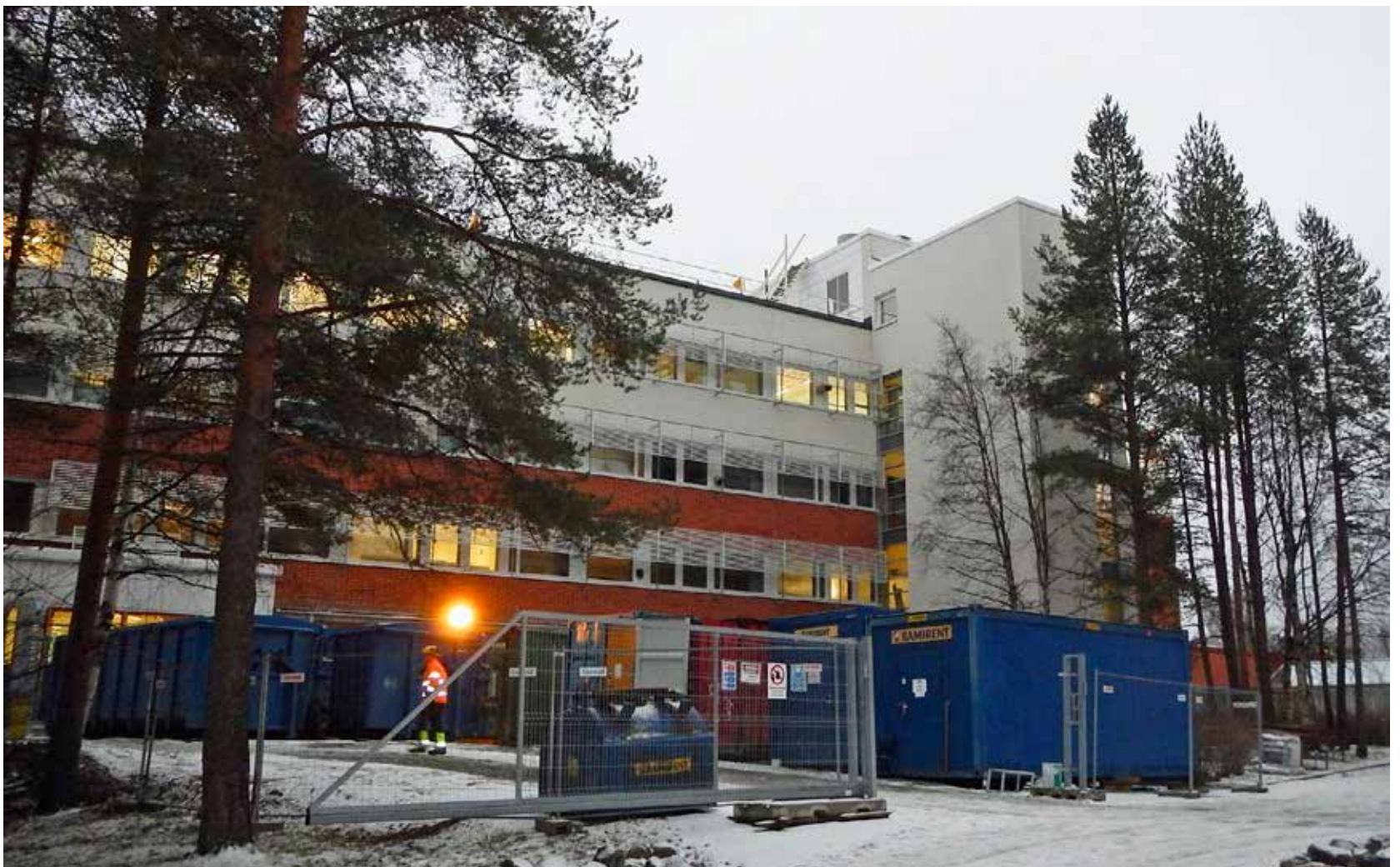
Rovaniemen yliopistorakennukset aiotaan saada nyt kerralla kuntoon.