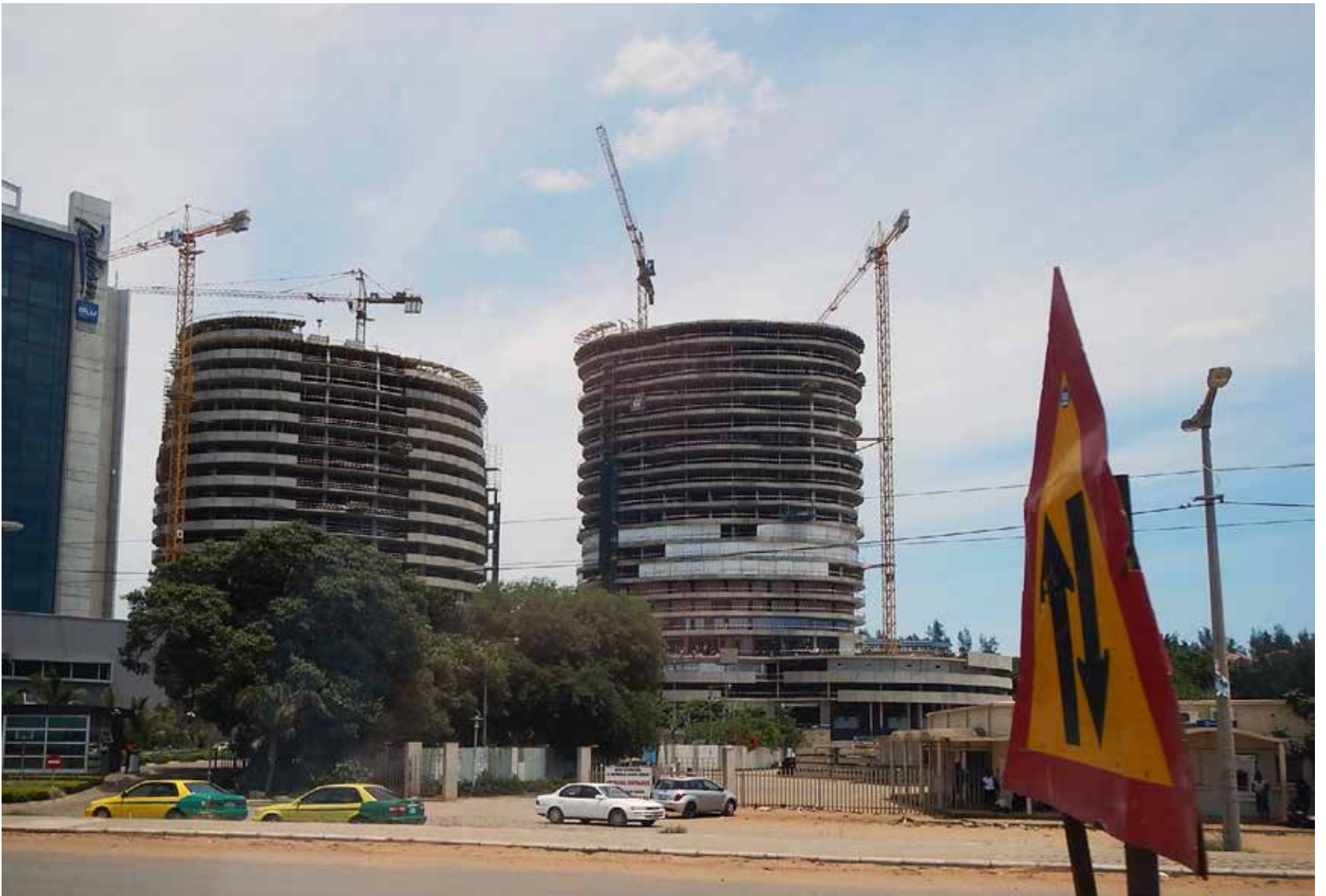
Mosambikin taivasta koristavat joka suunnassa nosturit. Rakentaminen on äärimmäisen vilkasta.