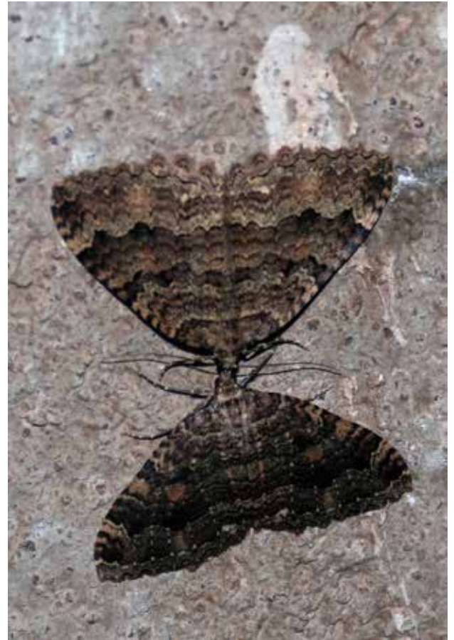
Nämä kiiltomittarit olivat eri päivinä eri asennoissa toisiinsa nähden, tämä oli kuvio viimeisenä päivänä.