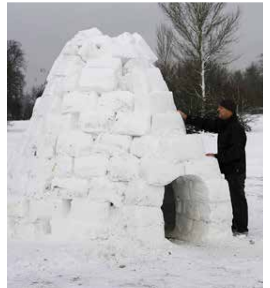
Nyt vaan odotellaan koko Suomeen rakennuskelejä.