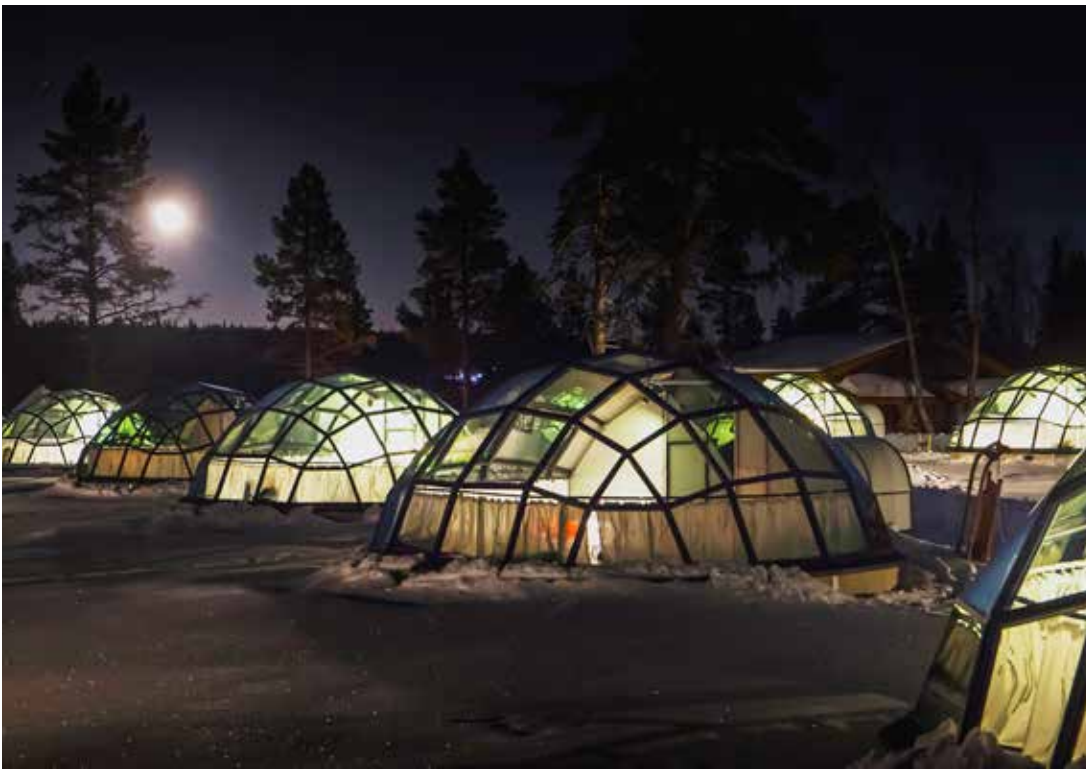
Hotelli Kakslauttasessa voi ihailla revontulia lasi-iglussa köllien.

Toissapäivänä satoi räntää ja eilen pakasti. Tänä tuiskuaa ja huomiseksi on luvassa vesisade, ylihuomiseksi lumimyräkki. Tällaista talvikelien kuurupiiloa on eletty marraskuusta lähtien. Tämä talvi ei ole vitkastelijoita varten: jos haluaa rakentaa lumilinnan, se on tehtävä heti kun lunta sataa... sillä jo huomenna kaikki lumi voi olla muisto vain.