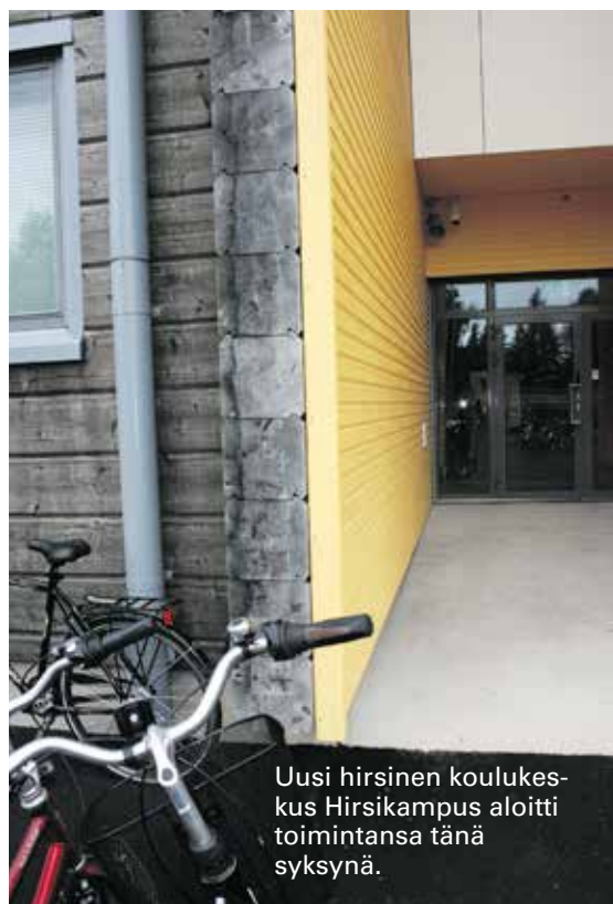
Uusi hirsinen koulukeskus Hirsikampus aloitti toimintansa tänä syksynä.

– Meillä panostetaan myös kalustoon, on huippukoneet käytössä. Ei tarvitse millään vanhoilla ränkkäreillä tehdä töitä. ■