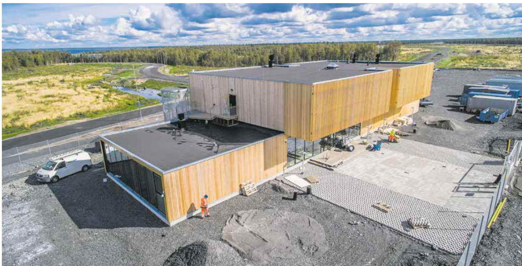
Ensimmäinen kiinteä rakennus Hanhikiven niemellä on Fennovoiman koulutusrakennus, joka valmistuu kesällä 2016.