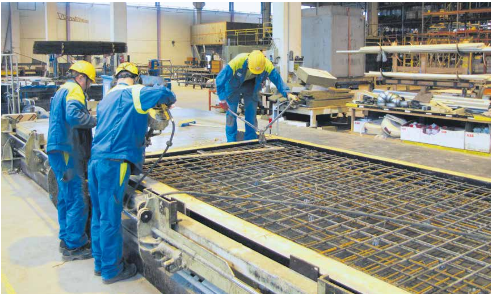
Parman Kangasalan tehtaan tuotantolinjalta valmistuu kymmeniä julkisivuelementtejä päivittäin.