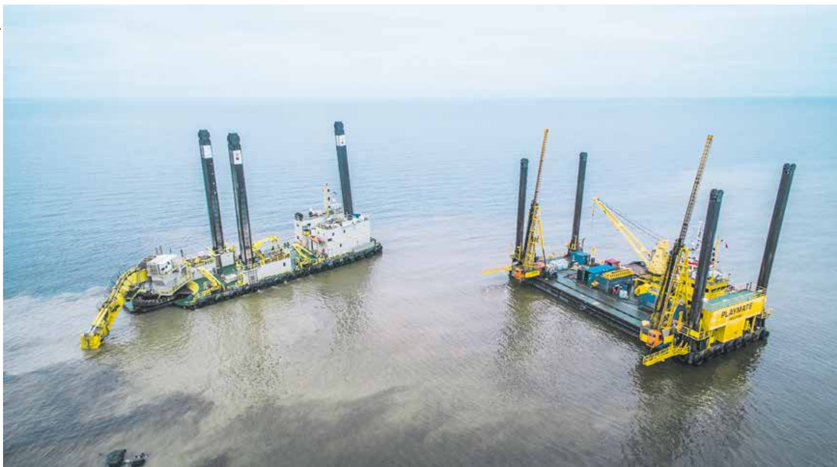
Hanhikiven väylää ruopataan 12 kuutiometrin kauhalla. Suurin tälle kaivurille sopiva kauha vetää 21 kuutiometriä.