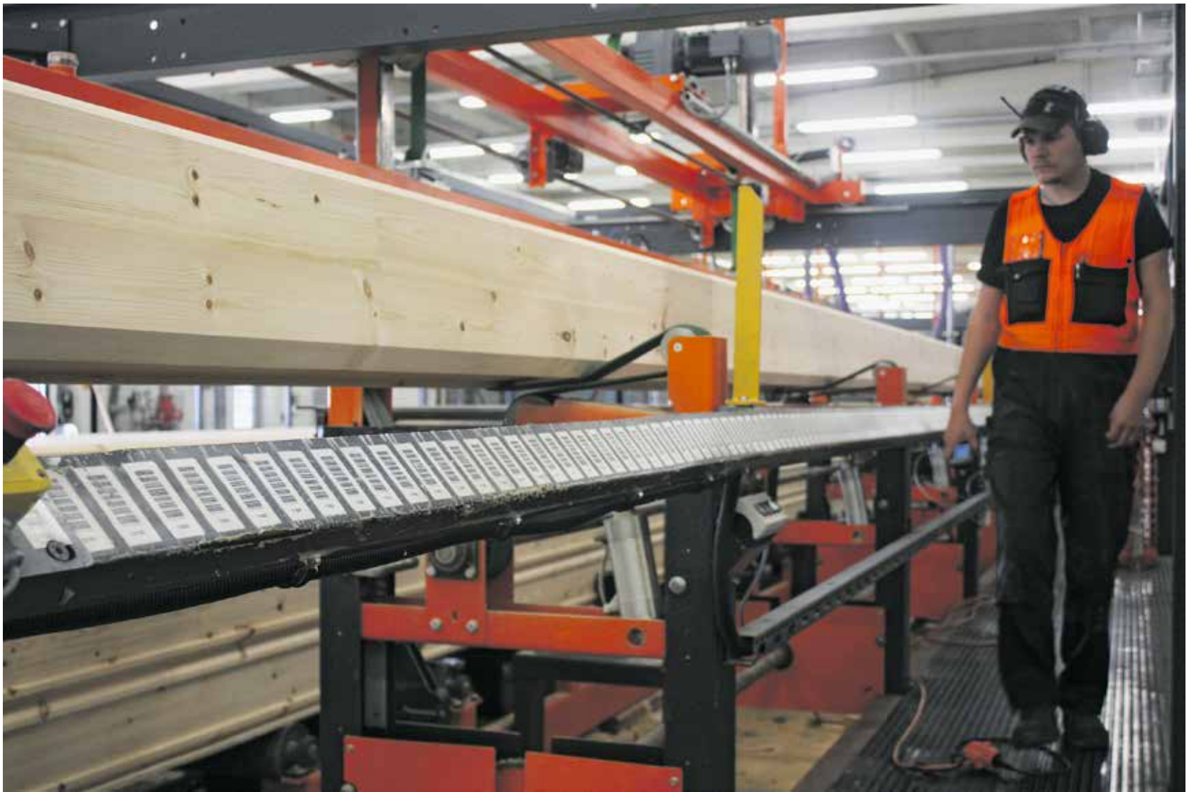
Salvuulinjalla Tero Laakkonen.