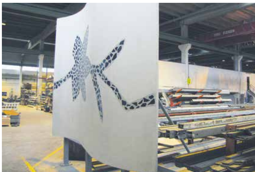
Tällaisiakin ovat elementit nykyään. Tämä Helsingin Arabianrantaan tarkoitettu julkisivuelementti on pantu näytteille Parman Kangasalan tehtaalle.

– Yleisesti ottaen työsuojelumääräyksiä noudatetaan hyvin. Jos joku on joskus ”unohtanut” turvavälineet, ne kyllä otetaan käyttöön kiireen vilkkaan kun asiasta huomautetaan. ■