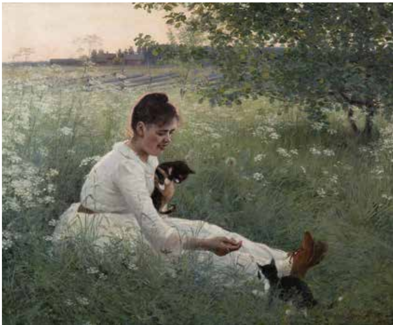
E. Danielson-Gambogi Tyttö ja kissat kesäisessä maisemassa (1892). UPM-Kymmenen Kulttuurisäätiön kokoelma.