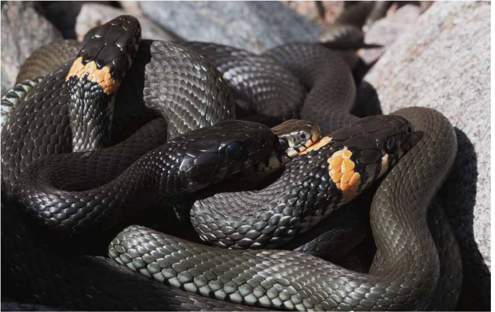
Rantakäärmeiden parittelupallossa naaras on isoin, koiraat yrittävät itse kukin parhaansa mukaan tulla muita halutummaksi.