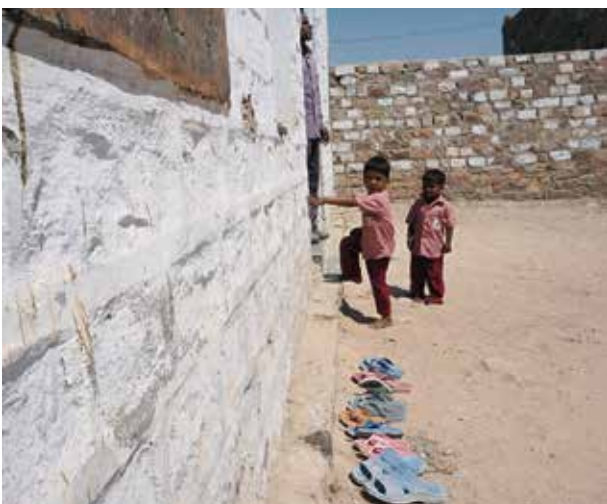
SASKin ja Rakennusliiton tukevat työtä lapsityön kieltämiseksi.

– Ajattelen että jos on toivoa, se kannattaa. ■