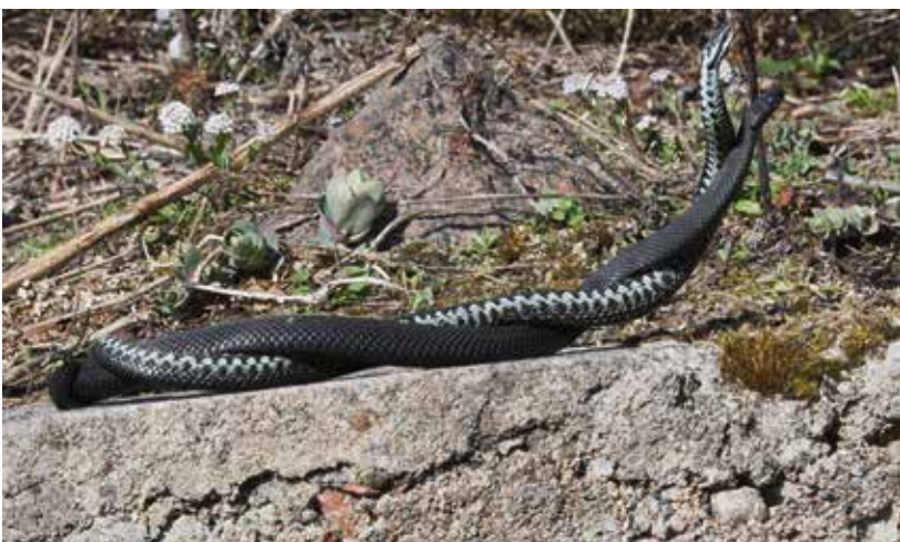
Musta ja sinertävä kyykoiras mittailevat voimiaan.

Toisinaan koiraat painivat eli tanssivat keskenään paritteluaikeudesta. Ne kietoutuvat toisiinsa ja yrittävät painaa kilpakosijan maahan. Heikompi lähtee karkuun. Aina taistelua ei tarvita, järjestys selviää muutenkin. Voittaja aloittaa pian naaraan houkuttelemisen parittelemaan.