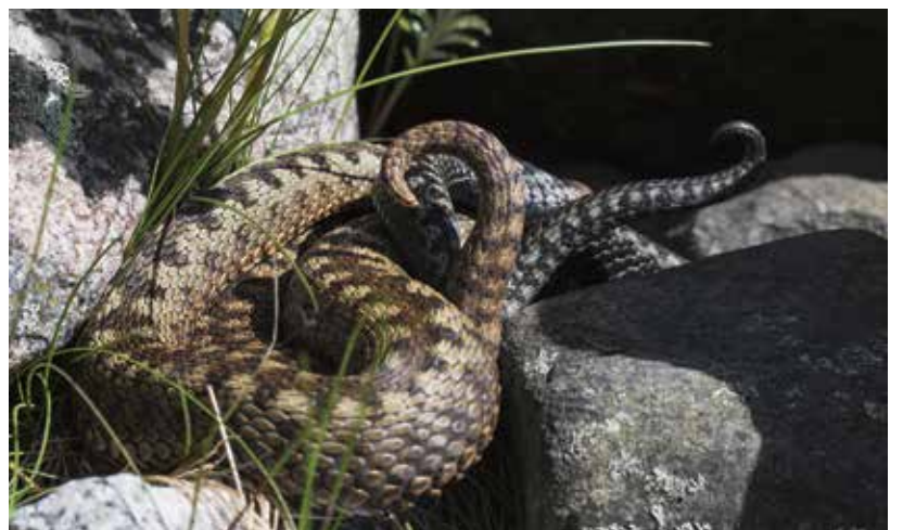
Hännät heiluvat kyiden parittelun alkuvaiheessa, naaras ruskea, koiras sinertävänharmaa.