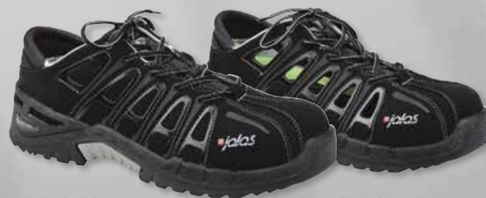
JALAS® 9568 SUOJALUOKKA S3 SRC HRO

Juoksujalkineen iskunvaimennus. Kiipeilykengän pito. Aktiivisesti käyttömukavuutta parantavat tekniset ominaisuudet. Vuosien hienosäädön tuloksena voimme todeta, että musta turvajalkineemme on nyt täydellinen.