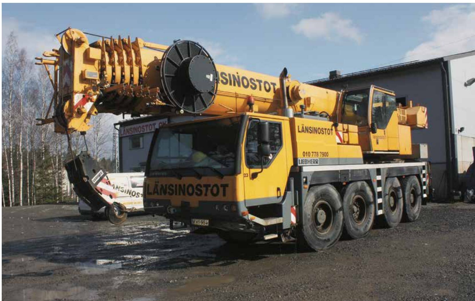
Ajoneuvonosturi, jonka nostokyky on 70 tonnia.