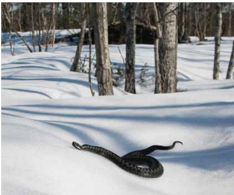
Koiraskyy matkalla päivipaikasta toiseen huhtikuussa.

Parittelu kestää noin tunnin tai kaksi, koiras on piikkisellä helmipeniksellään hyvin kiinnittyneenä naaraan kloaakkiin. Kyyt parittelevat yhden tai muutaman puolison kanssa, ensimmäisenä paritellut koiras hedelmöittää eniten munia. Hedelmöitys tapahtuu vasta noin kuukauden kuluttua parittelusta.