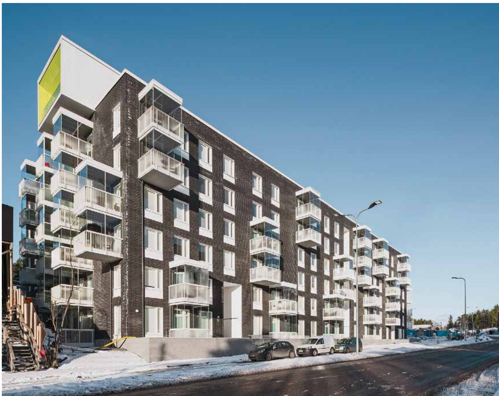
Uusinta vuokratuotantoa edustaa Helsingin Koirasaarentie Laajalahdessa.