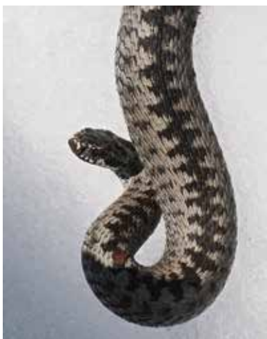
Saappaan jälkeen joutunut kyy vaihtaa kulkusuuntaa.

Kevät on parasta ja helpointa aikaa käärmeiden tarkkailuun. Liikkuvia koiraita seuraamalla voi päästä vaikka paritteluja seuraamaan. Rantakäärmeet parittelevat suunnilleen vappuna etelässä, kyyt viikon tai kaksi myöhemmin, olosuhteista riippuen. Toisissaan kiinni olevia käärmeitä sopii hyvin seurata, kunhan on rauhallinen. Yleensä käärmeet eivät tee mitään, siis vain lämmittelevät, mutta keväällä ne ovat vilkkaampia. ■